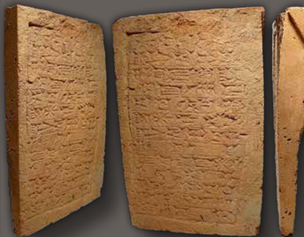
II. Nabú-kudurriuszur király (Kr. e. 604–562) körbefűrészelt téglafelírata, melynek hátlapján jól láthatóak a körfűrész nyomai

Az Iraq Museumban történt fosztogatás mindazonáltal eltöri amellet a pusztítás mellett, amely az 1990–2000-es években érte Irak régészeti lelőhelyeit. Bár a legális útvonalak tehát legkésőbb 1974-ben megszűntek, a kereslet természetesen megmaradt. A tiltást megelőzően külföldre került