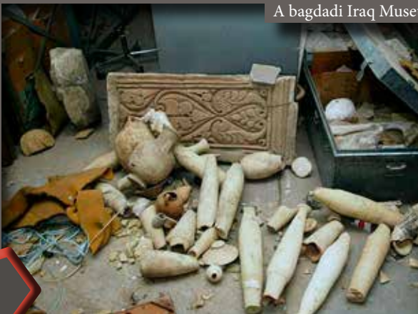
A bagdadi Iraq Museum a fosztogatások után

Az illegális műkereskedelem a kulturális örökség egészét sújtó probléma. Az ezt övező diszkréció miatt a közvélemény azonban csak ritkán hall róla, többnyire egy-egy műtárgy lefoglalása vagy visszakövetelése kapcsán. Egy műtárgy elsősorban előkerülésének vagy megszerzésének körülményei folytán válhat illegális tulajdonná. Bár a kétes eredetű tárgyak kereskedelmét ma már szigorú törvények és nemzetközi egyezmények tiltják, ezek gyakran nem érik el a kívánt hatást. Emiatt az illegális műkereskedelem mára a feketepiac egyik legjövedelmezőbb ága lett.