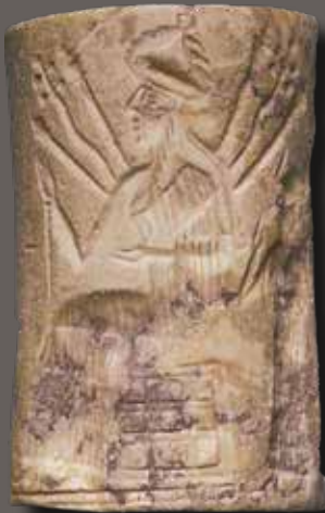
Akkád kori (Kr. e. 24–22. sz.) pecsét-henger és modern lenyomata egy 2013-as aukcióról

Sajnálatos módon a szakemberek is megosztottak abban a kérdésben, hogyan viszonyuljanak a nagy számban megjelenő, tisztázatlan eredetű tárgyhoz. A régészek többsége teljesen elhatárolódik ezek publikálásától, míg a szövegekkel dolgozó szakemberek többsége nem foglalkozik azzal, milyen leletek pusztulnak el egy-egy tábla előkerülése során, és csak a szövegből kinyerhető információkat látja. Egy tábla régészeti kontextusa pedig döntő fontosságú. A fentiekből következően az ilyen műtárgyak pontos előkerülési helye ismeret-