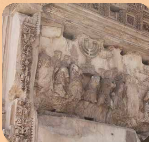
A Forum Romanumon álló Titus-díadalív a jeruzsálemi Nagytemplom kincseivel vonuló római katonákkal

A kulturális javakkal való illegális kereskedelem korántsem pusztán külön törvényszegők hóbortja vagy fehérgalléros bűnözés. Az alkalmi lopásoktól a szervezett bűnözésig terjedő skálán mozog, és az illegális fegyver- és droggereskedelem mögött a feketepiac 3. legjövedelmezőbb ága. A globalizáció előrehaladtával és a technológia fejlődésével egyre inkább nemzetközi és az online térben terjedő jelenségről kell beszélnünk. A Wall Street Journal 2017-es kutatása szerint naponta több mint 100.000 régiség kerül eladásra online, és ezek 80%-a lopott vagy hamis. Sok esetben a social media felületei, de különböző üzenetküldő applikációk is csatornaként szolgálnak, ami a bűnüldöző szervek számára szinte lekövethetetlenné teszi a folyamatot.