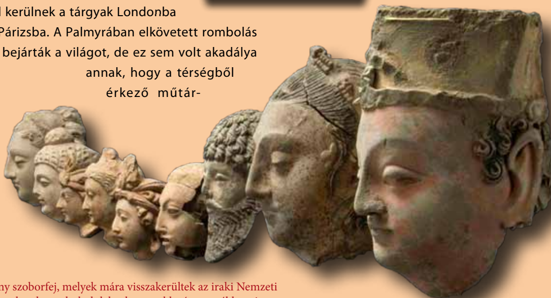
Néhány szoborfej, melyek mára visszakerültek az iraki Nemzeti Múzeumba, de az elrabolt leletek nagyobb része továbbra sincs meg