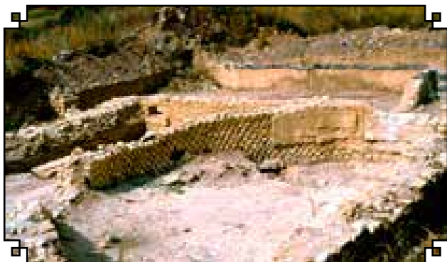
Apszis (opus reticulatum technikával) és környéke az első villaperiódusból