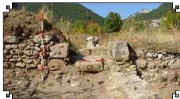
Kőből épült fal az első periódusból

Az Adria szintje felett 1053 méter magasan fekvő völgybe épített kb. 200×100 méter alapterületű villa déli része az erózió és a mezőgazdasági művelés következtében olyan mértékben pusztult el, hogy kiterjedését is csak a nyomokban megmaradt alapfalak alapján határozhattuk meg. A villagazdaság helyiségei három nagy udvar köré épültek. A két északi udvar körül sorakozó, egy korábbi épületet is magába foglaló helyiségek nagyjából egyidősek. A déli traktust építették a legkésőbb a villához, amelynek összesen 60 helyiségét tártuk fel. Az egyes építési korszakok falazási technikája különböző volt. Az első periódusban a villa kőből épült, csak elnagyoltan faragott kővekből kialakított falakkal. A legkorábbi épület déli részén egy apszisos [félkörös, fülke alakú résszel ellátott – a szerk.] helyiséget tártunk fel. Az első villának az egyik leghangsúlyosabb