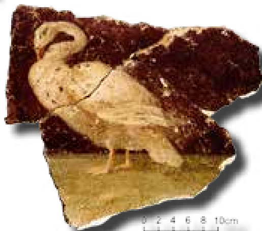
Hattyút ábrázoló freskótöredék a lakó udvar keleti helységről

Az Antoninusok korában újabb földrengés miatt a villa ismét újjáépítésre szorult. A leginkább sérült részeket felhagyhatták, más részüket átépítették. A villa legkésőbbi, déli szárnyát egy 195-ben vert Septimius Severus-érem alapján keltezhetjük. Ez a szárny gazdasági rendeltetésű építményeket foglalt magába.