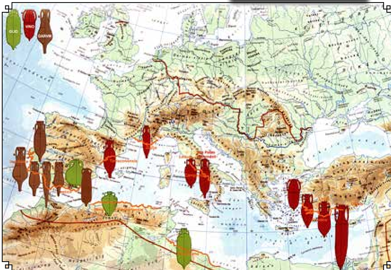
Olaj (zöld), bor (bordó) és garum (barna) legjelentősebb importhelyei a Római Birodalom területén

A villa középső részén, egy korábbi fürdőépítmény helyén, annak alapfalait felhasználva, csak több mint 500 év múlva épült fel egy kb. 19×13 méteres alapterületű templom, kis félkör alakú apszissal, amely feltehetően a betelepülő, romanizált longobárd lakosság településéhez tartozhatott. Egy 1074-es forrás még egyúttal említi a vár és a korábbi villa területén épült templomot. A völgyben épült templom körül létesült temetőnek mintegy 60 sírját tártuk fel, ezenkívül az osszarium [csontház, emberi csontok gyűjtőhelye – a szerk.] még megszámlálhatatlan csontot rejtett. A temető a 9. századtól legalább a 13. századig használatban lehetett. A sírok sokszor a villa falai felett kerültek elő, azok nagy részét tehát már kiszedhették, így a középkorban már nem láthaták. Leletek alapján még 14–15. századi megtelepedéssel is számolhatunk a területen. A villa köveit a tőle aránylag messze lévő vár építésére is felhasználták.