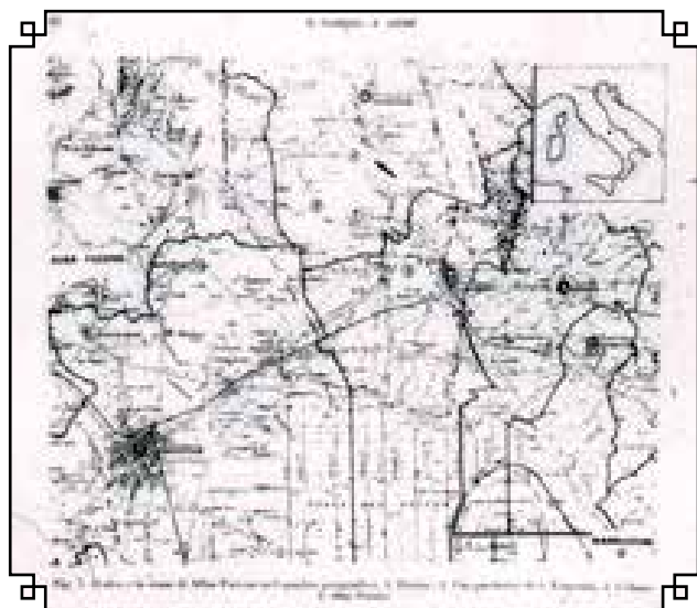
San Potito helye és környéke

K özép-Itáliában, az Appenninek hegylánc egyik észak–déli irányú völgyében, San Potitóban magyar régészként 1983 és 2009 között tártunk fel egy nagyobb méretű római villát. Feltárásainkat a helyi önkormányzat is támogatta, de arra is sor került, hogy az ásatásokat lelkesen pártoló helyi plébános lutrit szervezett a munka támogatására. Mi is vettünk szelvényt, ugyanakkor drukkoltunk, hogy ne nyerjük meg a főnyereményt, ami egy élő bárány volt, mert ennek repülőgépen történő hazaszállítása nem lett volna könnyű.