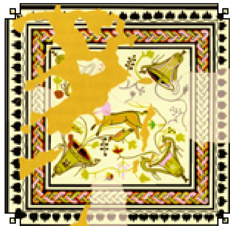
Mozaikpadló emblémája a lakóudvar keleti helyiségsorából