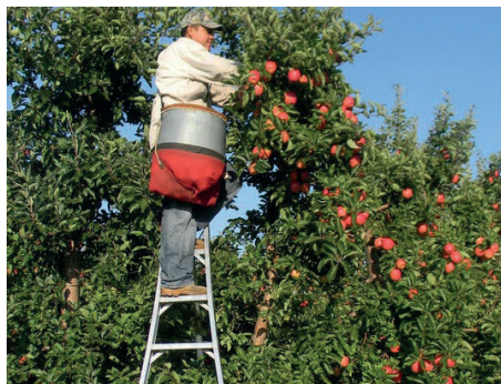
A létra magasságát úgy válasszuk meg, hogy az utolsó előtti szintről kényelmes legyen a munkavégzés