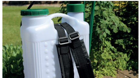
Lemosó permetezésre a kézi háti permetező alkalmas

Kiseb fáknál elég a háti permetező, ami gyomirtásra, a fák, bokrok egész éves növényvédelmére való. A tavaszi/őszi áztatásszerű lemosó permetezésre is ez a legjobb, mert ez képez megfelelő cseppméretet. A legjobbak azok a típusok, amelyekhez minden alkatrészt külön-külön is megvásárolhatunk. Mivel ezek nem olcsók, érdemes a javításukra odafigyelni. 5-20 literes változatokban kaphatók. Ma már akkumulátorral meghajtott háti permetező is kapható, amelynél az elektromosság pumpál helyettünk.