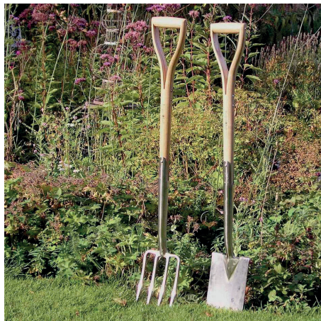
Ásóvilla és ásólapát

Laza vagy kötött talaj forgatás nélküli lazítására, levegő bejuttatására való. Biokertekben, magasságokban ezzel az eszközzel végezzük az őszi talajlazítást, de az ásóvilla a legjobb a gumós, rizómás évelőink kiemeléséhez, tőosztással való szaporításuk elvégzéséhez, ugyanis nem vágjuk szét vele a növényi részeket.