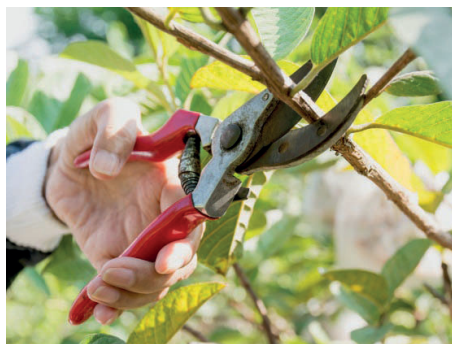
Kaphatók balkezes ollók is

A legdrágább kerti eszközünk, de nagy gyümölcsösökben, magas fáknál elengedhetetlen, hiszen ezzel gyorsan és hatékonyan tudjuk a növényvédelmet elvégezni. A légáram miatt magasra, akár 6-7 m-re is feljuttatja a permetszert, és a leveleket jól megforgatja, így egy sűrű korona belsejében is hatékony a növényvédelem. Lemosó permetezőkre ezeket a típusokat ne használjuk, arra a kézi háti permetező a legjobb.