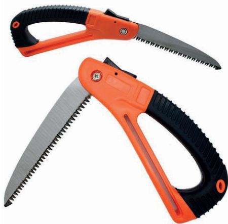
A legjobbak az összehajtható bicskafűrészek

A vastag ágakat vágás előtt alulról mindig vágjuk be, és azután fűrészeljük felülről. Vannak