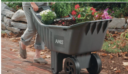
A talicska is sokféle lehet