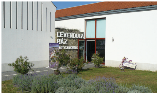
Legvirágosabb község 2016-ban: Tihany

A szeptemberben, Brnóban rendezett európai díjátadón Mosonmagyaróvár és Dunakiliti ezüstérmét nyertek. Mosonmagyaróvár felkészülését a legszeb főtérért járó zsűrielnöki különdíjjal is jutalmazták, továbbá elismerő oklevelet kaptak a Futura Interaktív Természettudományi Élményközpontért, Dunakiliti pedig a „zöld óvodaként” működő Kiserdei Óvodáért.