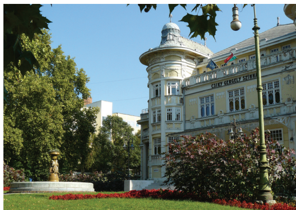
Legvirágosabb város 2016-ban: Kaposvár