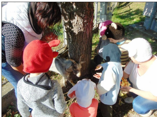
A baki gyerekek a felelős állattartásról tudtak meg többet.

természetfotós pedig interaktív könyvbemutató órával járult hozzá a téma rendhagyó feldolgozásához. Különleges lehetőség volt a mandalafestés a könyvtárban Kónya Zsuzsa révén, hiszen ebben a tevékenységben is fontos szerepe van a természetes szimbólumoknak, ember és természet harmóniájának.