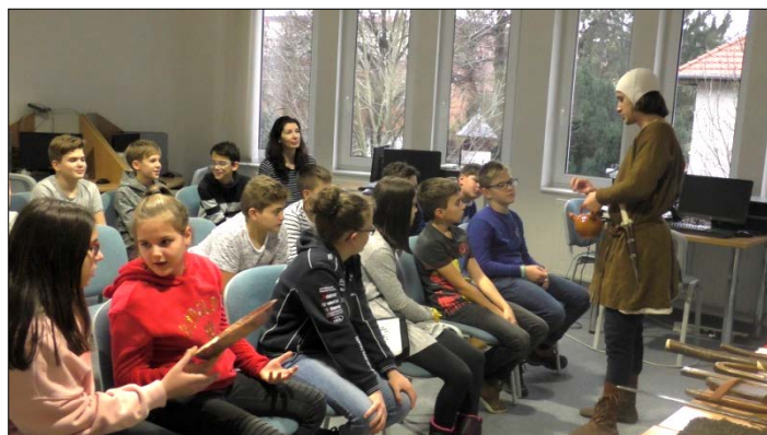
Foglalkozás a Halis István Városi Könyvtárban