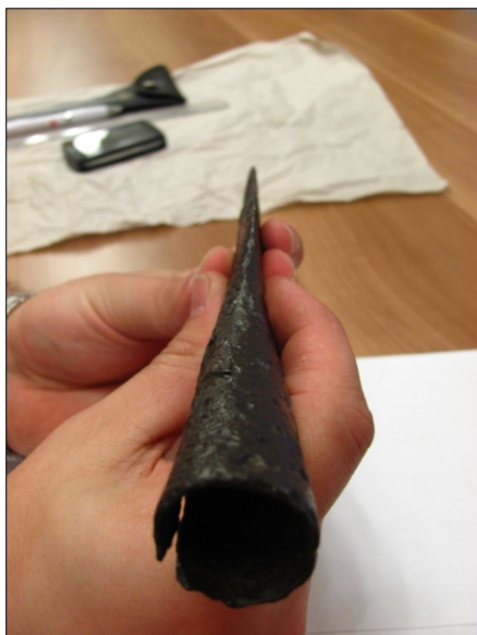
Árpád-kori lándzsahegy méreteit vesszük le a Nemzeti Múzeumban

Az XXI. század információszolgáltatásában az egyik legnagyobb probléma az álhírek tömeges jelenléte mind a nyomtatott, mind az online felületeken. Sajnos azonban nem kizárólag az említett helyeken találkozhatunk hiteltelen, vagy csak részben hiteles információval. Felmerül a kérdés, hogy a könyvtárakban tartott programokon elhangzó információk hitelesek-e?