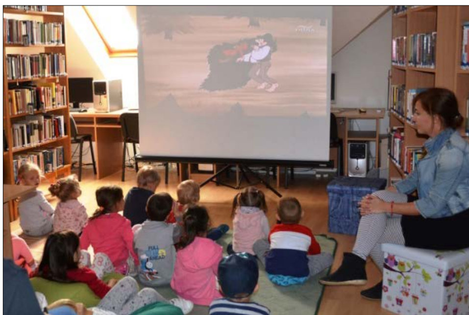
A nagylengyeli ovisok a Magyar népmesék egyik epizódját ismerték meg a játékos foglalkozás előtt.

Zala megyében 98 településen voltak rendezvények az OKN hetében: 9 városban, 87 szolgáltatóhelyen (ebből 42 település tartozik Zalaegerszeg ellátási körzetébe), valamint Balatonyörökön, Vonyarcvashegyen és Gyenesdiáson. Összesen 215 programot szerveztek Zalában, több mint 7200 fő részvételével. A gyermekeket vidám mesedélutánok, számos kreatív foglalkozás, könyvtári kincskeresés várta a zalai bibliotékákban. A Könyvtárközi keretében – egyúttal a Népmese Napjához is kapcsolódva – például a Magyar népmesék és a Cigánymesék c. sorozatokból szemezgettek az előadók, vagy épp mesemondók és papírszínházi előadások szórakoztatták a kicsiket.