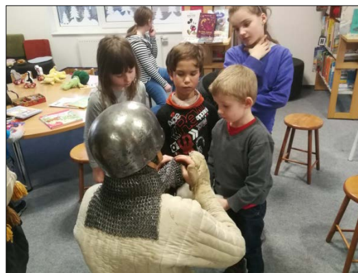
Érdeklődő gyerekek egy délutáni foglalkozáson