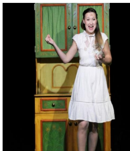
Kalimpa Színház: A királykisasszony cipője c. előadás