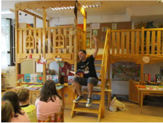
Író-olvasó találkozó Vig Balázssal