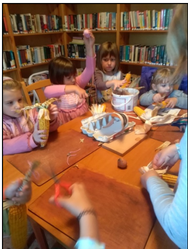
Meselesen a nemesrádói fiatalok