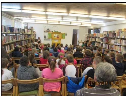
Kalimpa Színház Zalabérben