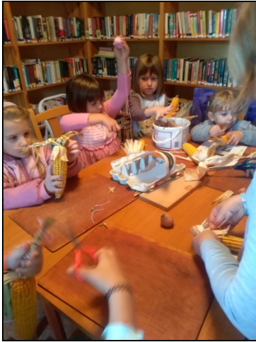
Meselesen a nemesrádói fiatalok