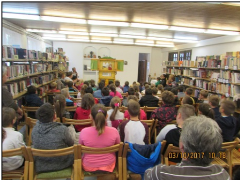
Kalimpa Színház Zalabérben