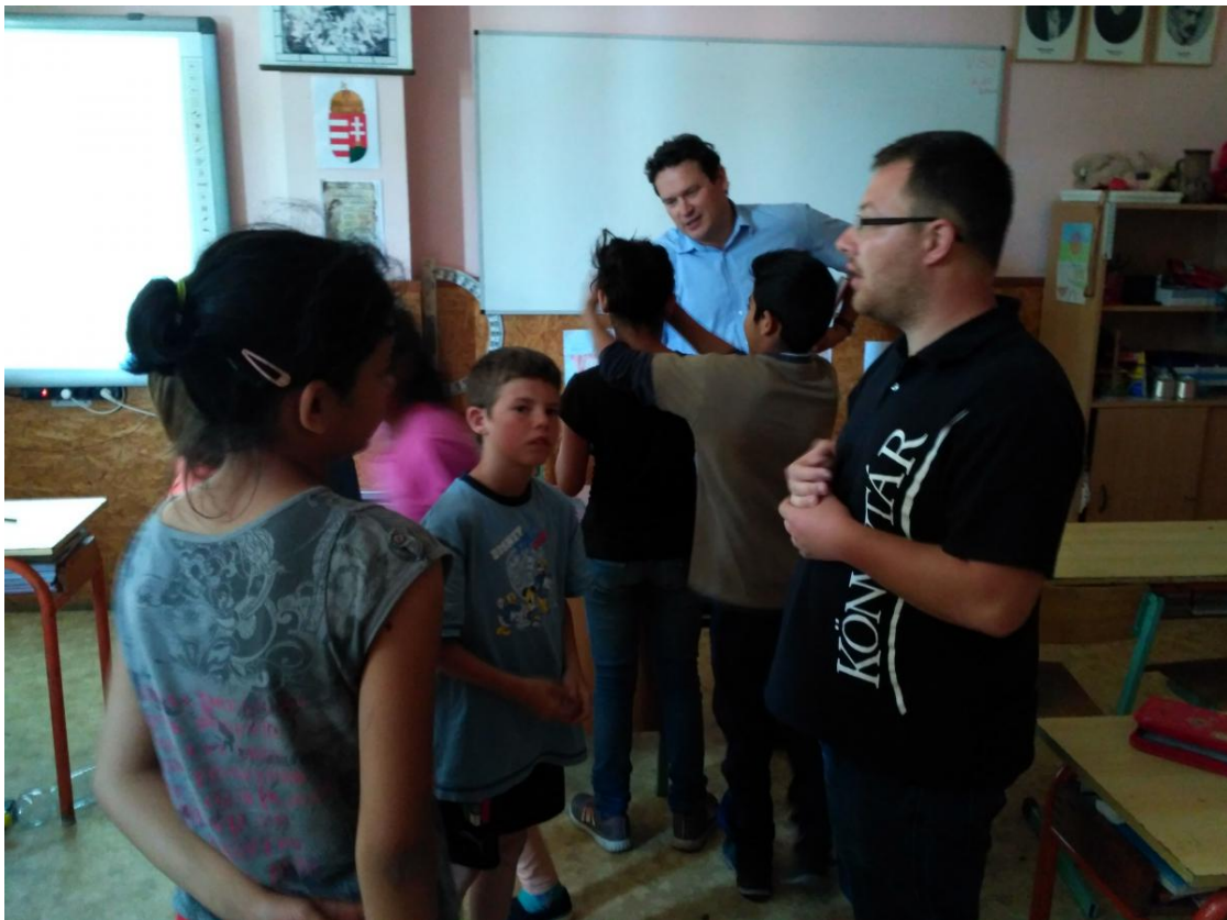
Élő történelem előadás Csapiban és Zalasabarban

A nagykanizsai KSZR keretében 2017-ben Murakeresztúron, Csapiban és Zalasabarban jártunk, Nagykanizsa vonzáskörzetén túl pedig Zalaszentivánon, ahol az 1956-os emlékévé rendezvénysorozatához kapcsolódtunk. A Halis István Városi Könyvtárban pedig a reformációs emlékévé alkalmából mutattunk be új témát, melyben Luther Márton és Kálvin János fellépését dolgoztuk fel. A szolgáltatást 2018-ban is bátran ajánljuk a települések számára. A programról bővebb tájékoztatást ad honlapunk: http://nagykar.hu/elotori , valamint a facebook-csoportunk (Élő Történelem Teaház). Minden érdeklődést szeretettel fogadunk.