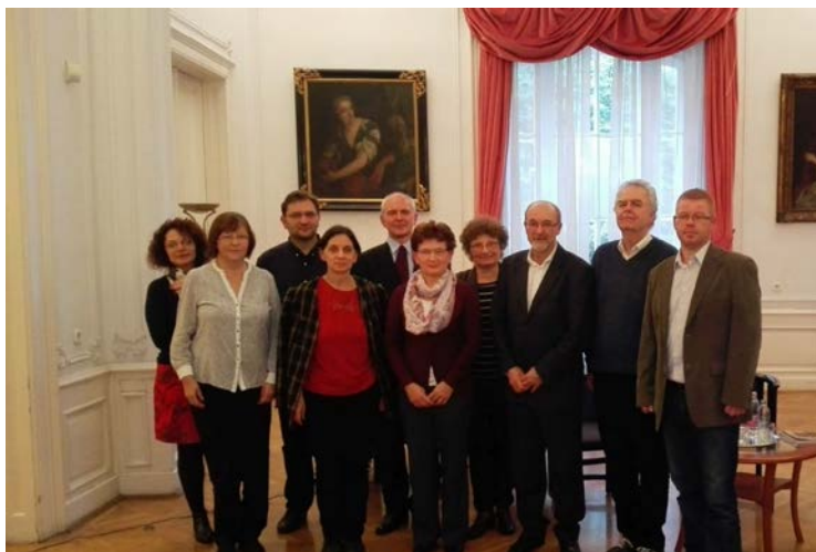
A kötet címlapja és a budapesti kötetbemutató résztvevői