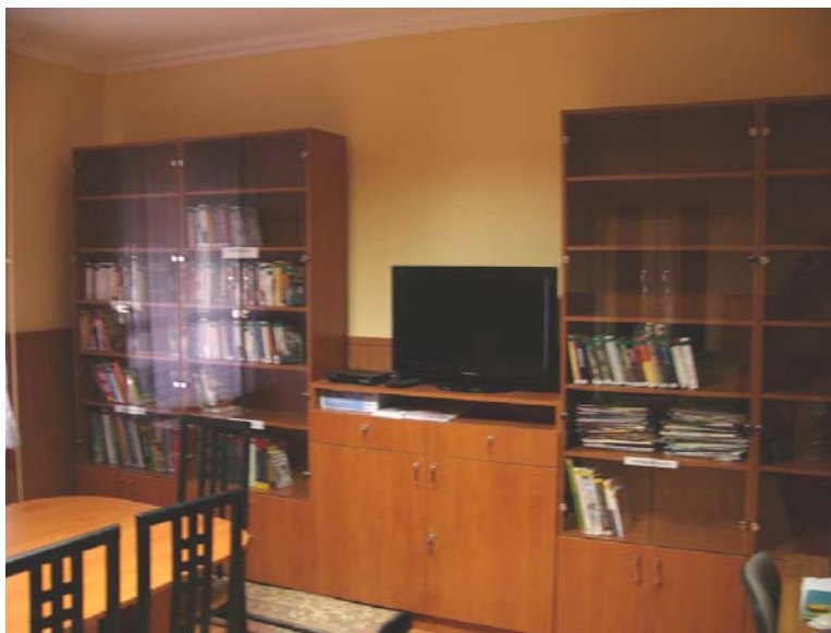
Új berendezést kapott a szolgáltatóhely Bödeházán

A rédicsi körjegyzőség területéről 5 nyertes pályázó könyvtár berendezési tárgyak vásárlására kapott összegeinek felhasználása is megtörtént. A fejlesztés értéke 2.048.000 Ft.