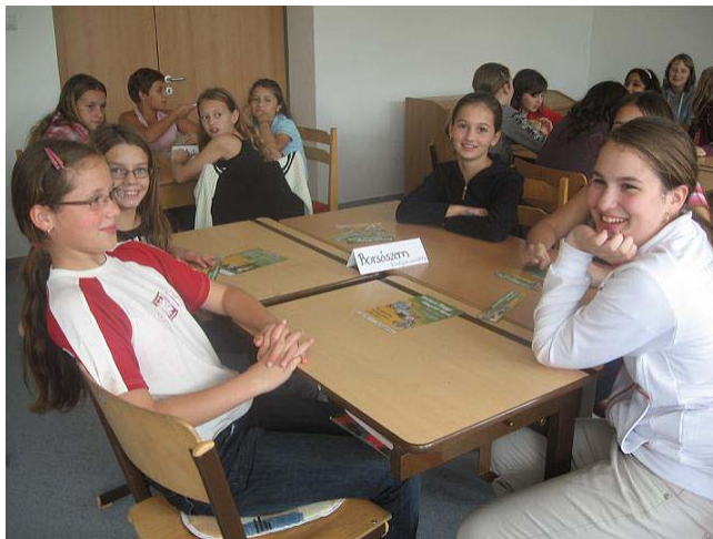
Az október 9-én rendezett mesevetélkedő résztvevői