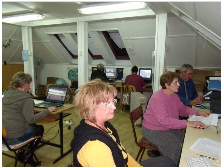
Internet tanfolyam Pusztaszentlászlón