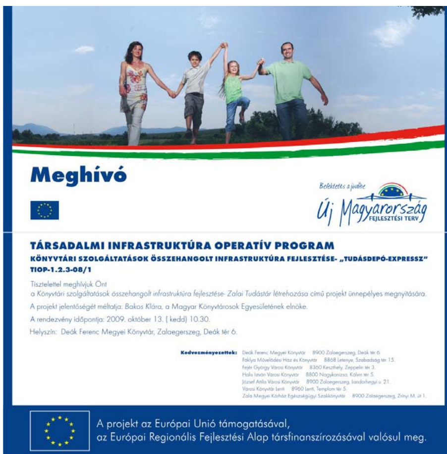
Az ünnepélyes megnyitó meghívója