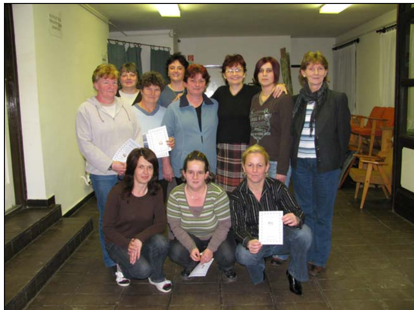
A csonkahegyháti internet tanfolyam résztvevői