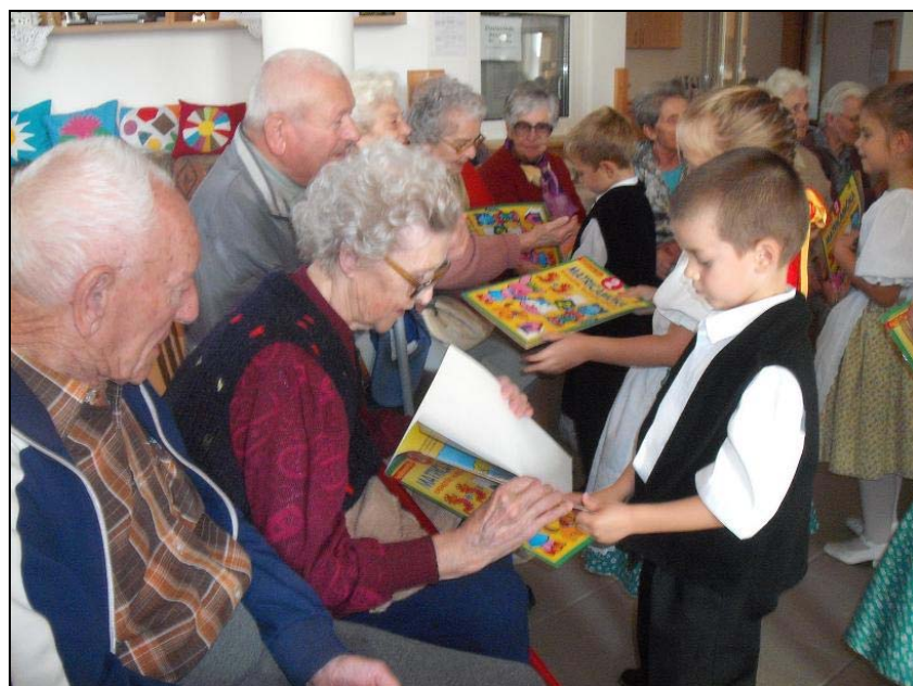
Közös képeskönyv nézegetés az idősekkel.