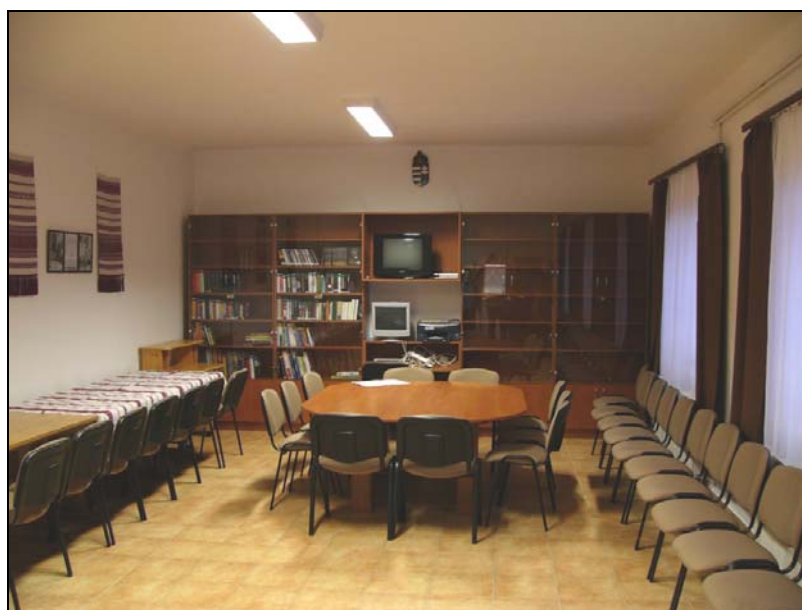
... és Zalaszombatfán is.

A lakosság közérdekű információkhoz való hozzáféréseinek javítása érdekében a szolgáltató helyeken a városi könyvtár szolgáltatásairól szórólapot biztosítottunk.