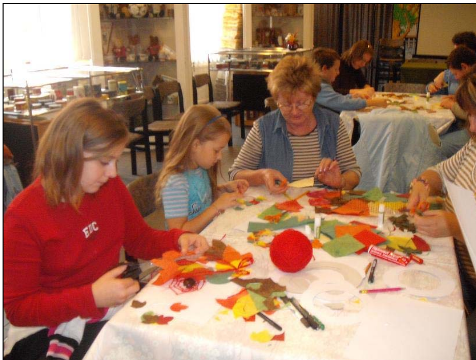
Kézműves foglalkozáson őszi termésekből készítettünk játékokat, díszeket.

Október 11-én, a Könyves Vasárnapon a könyvtár ünnepi nyitva tartással várta az érdeklődőket, olyan feltételekkel, melyre az év többi napján nincs lehetőség: ingyenes volt a beiratkozás és az internet használat is. De talán a legnépszerűbb lehetőség, mely a notórius későknek kedvezett: a lejárt határidejű könyveket büntetés nélkül vissza lehetett hozni a könyvtárba. Sokan éltek e lehetőséggel.