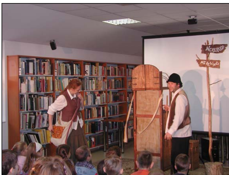
A Ziránó Színház előadása

Ezen a héten volt vendégünk a Ziránó Színház Csicseri történet c. bábjátékával, amellyel jó közönségre akadva nagy sikert arattak a gyerekek közt.