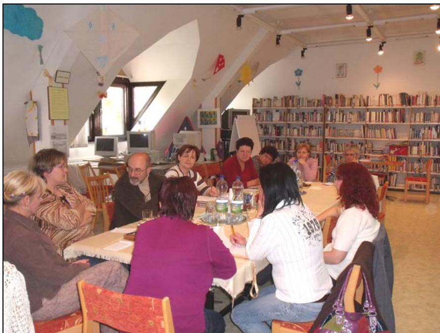
Az október 25-i szakmai továbbképzés résztvevői

„Digitális felzárkóztatás – könyvtárak az e-közzolgáltatásokért” címmel szeptember 21-én 10.00 órától a Deák Ferenc Megyei Könyvtárban információs napra kerül sor. A program megvalósítását a Magyar Könyvtárosok Egyesülete „MENET” elnevezésű infokommunikációs tárgyú pályázata tette lehetővé. A programra községi könyvtárosainkat is meghívtuk, de mindössze ketten vettek részt.