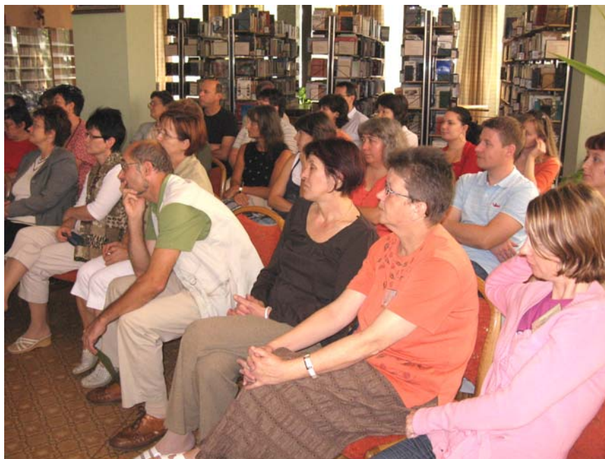
A MENET program keretében tartott továbbképzés résztvevői

2009 októberében is megszerveztük az „ Összefogás a könyvtárakért ” programsorozatot. A középpontba a nyugdíjas korosztállyal kapcsolatos előadások, bemutatók kerültek, de a fiatalok és az aktív korosztály is megtalálhatta a számára érdekesnek ígérkező találkozót, vetélkedőt, bemutatókat. Az Országos Nagy Könyvtári Napok programjai: