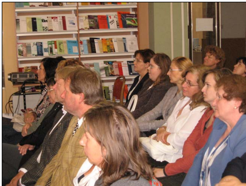
Az ünnepélyes megnyitó résztvevőinek egy csoportja