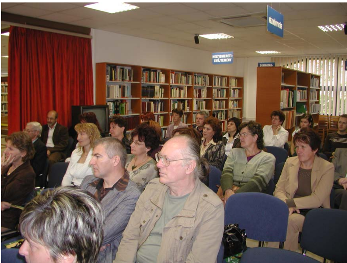
A szakmai nap résztvevői