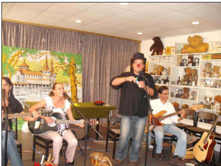
Délután a Hévíz Galéria Nagytermében a Brumi Bandi Band interaktív műsorán vehettek részt a kicsik

Október 11-én, a Könyves Vasárnapon a könyvtár ünnepi nyitva tartással várta az érdeklődőket, olyan feltételekkel, melyre az év többi napján nincs lehetőség: ingyenes volt a beiratkozás és az internet használat is. De talán a legnépszerűbb lehetőség, mely a notórius későknek kedvezett: a lejárt határidejű könyveket büntetés nélkül vissza lehetett hozni a könyvtárba. Sokan éltek e lehetőséggel.