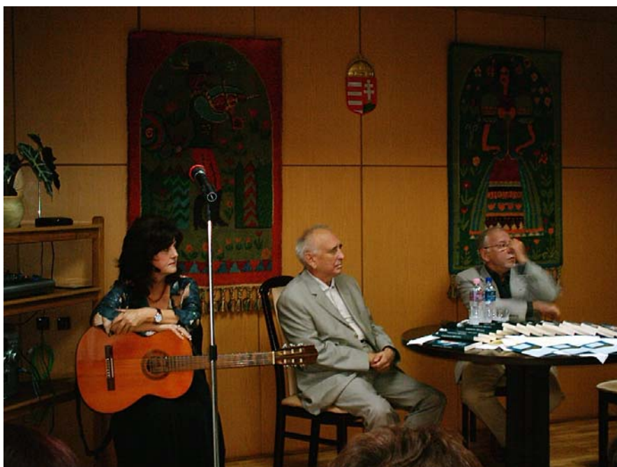
A nagykapornaki irodalmi est fellépői

2008. október 14-én író-olvasó találkozóra került sor Baranyi Ferenc Kossuth-díjas költővel Nagykapornakon.