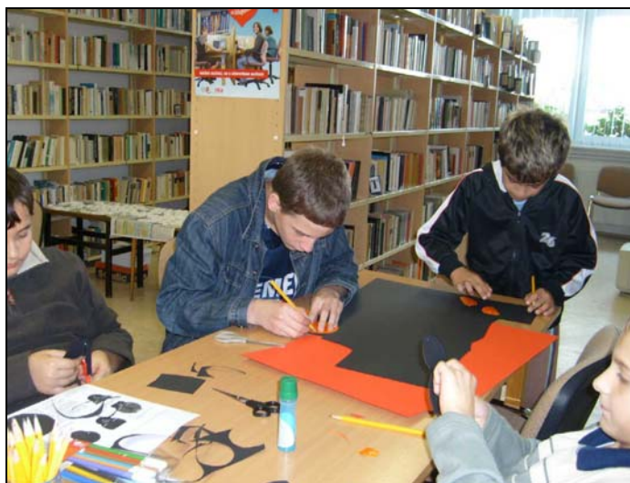
Pillanatkép a foglalkozásról

A Könyves Vasárnapon a mi intézményünk is nyitva tartott. Erre az alkalomra játszóházat is szerveztünk „Mesehősök papírból” címmel, Varjú Jancsit és Sün Balázst készíthettek a gyermekek. Az előző évhez képest sikeres volt a program, főleg azért, mert néhány felnőtt is betévedt.