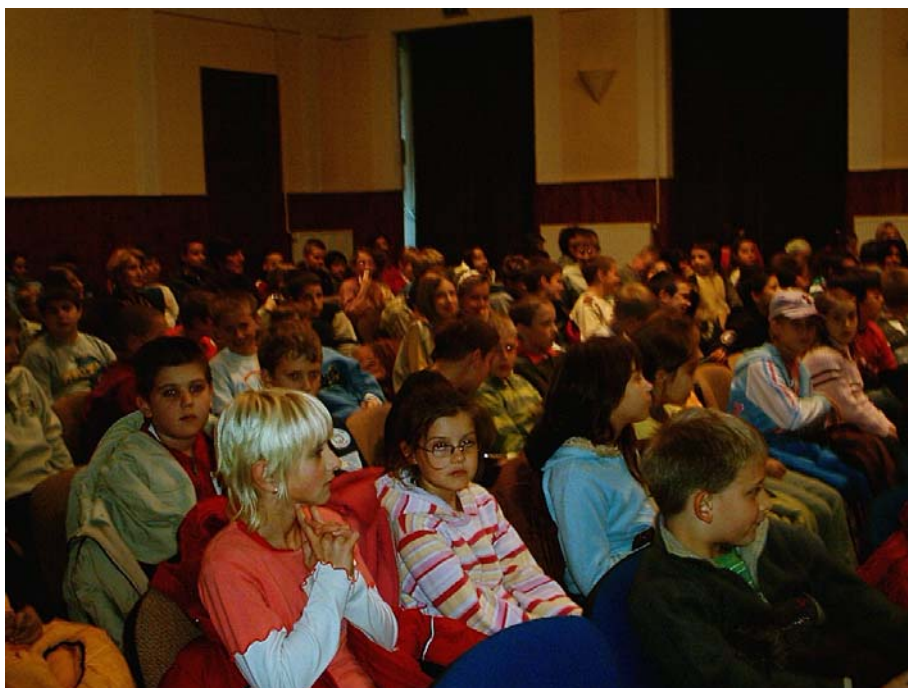
A Gellénházán tartott író-olvasó találkozó közönsége