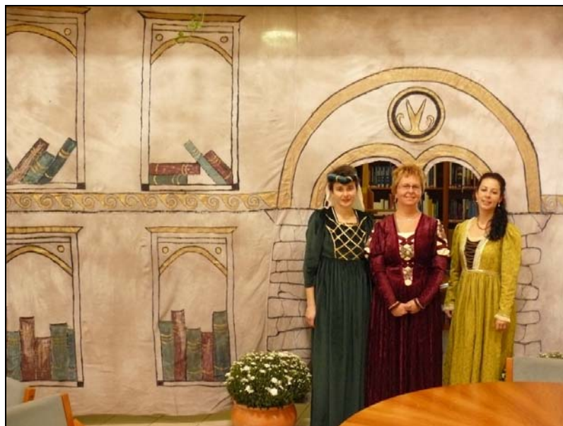
Keszthelyi könyvtárosok, mint a királyi kancellária tagjai