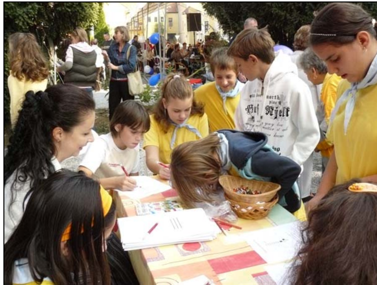
A gyerekek totót töltenek ki a könyvtár udvarán