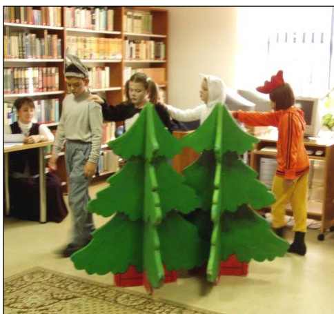
A Pais Dezső iskola tanulóinak műsora