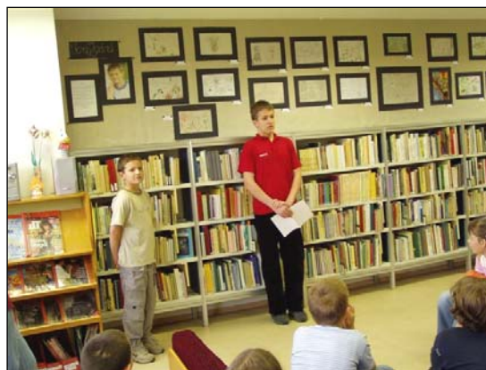
Vörös Zoárd: Az én világom (Eötvös József Székhelyiskola, Zalaegerszeg)