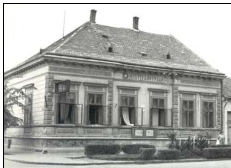
A zalaegerszegi Körzeti Könyvtár, majd Mezei Könyvtár épülete