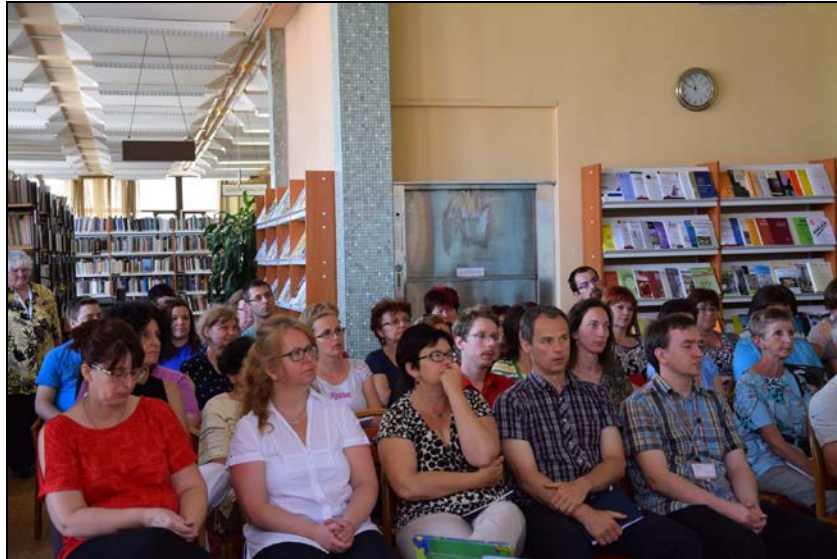
A szakmai nap résztvevői