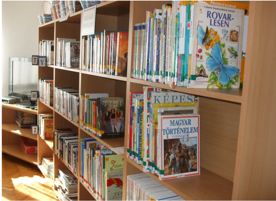
Új pocok Gáborjánházán