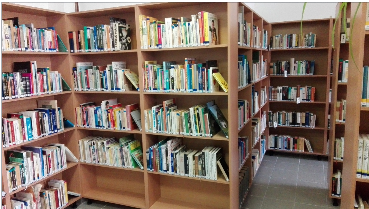
Megújult bútorzat Szentgyörgyvölgyön

Az elmúlt évek nagyarányú dokumentum beszerzése sokat javított - az állomány összetételének megújulásán kívül – a kistélepülési könyvtárak képén. Ennek ellenére néhány településen még régi bútorzat fogadta a látogatókat. Ezen igyekeztünk segíteni azzal, hogy az idei költségvetésből nagyobb összeget különítettünk el bútorzatfejlesztésre. Ennek eredményeképpen négy könyvtár berendezése teljesen megújult, további hat helyen részleges cserére, illetve a megnövekedett állomány miatt további polcok elhelyezésére is szükség volt. A Városi Könyvtár Lenti ellátási körzetébe tartozó települések közül még 2015 tavaszán adták át a felújított Többfunkciós Szolgáltató Központot Szentgyörgyvölgyön, ebben az épületben található a könyvtár is. Szükség volt az állomány selejtezésére, rendezésére, retrospektív feltárására, csak ezután kerülhetett sor a bútorzat megtervezésére, cseréjére, amelyre 2017. áprilisában került sor.