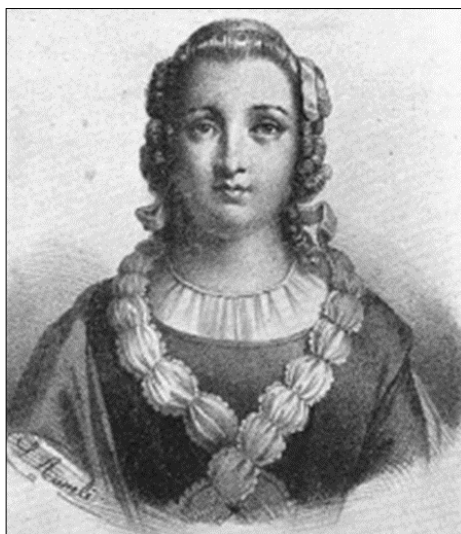
Anna Morandi (1714-1774)

Így hosszú ideig elérhetetlen lett a nők számára az orvosképzés és persze a gyógyítás is. Három évszázad után ismét az olaszok hozták a jó példát Anna Morandi személyében, aki férje mellett olyan szinten megtanulta a boncolás tudományát, hogy 1756-ban elnyerte a Bolognai Intézet anatómia professzori címét, sőt a Brit Királyi Társaság (British Royal Society) is tagjává választotta, és meghívta előadásra Londonba. Olaszországban a viasz anatómiai készítmények feltalálójaként és tökéletesítőjeként tisztelték.[14]