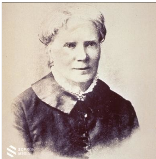
Dr. Elizabeth Blackwell (1821-1910), a világ első női orvosa

forrás: https://www.sopronmedia.hu/cikkek/forradalmarok-az-első-okleveles-noi-orvosok