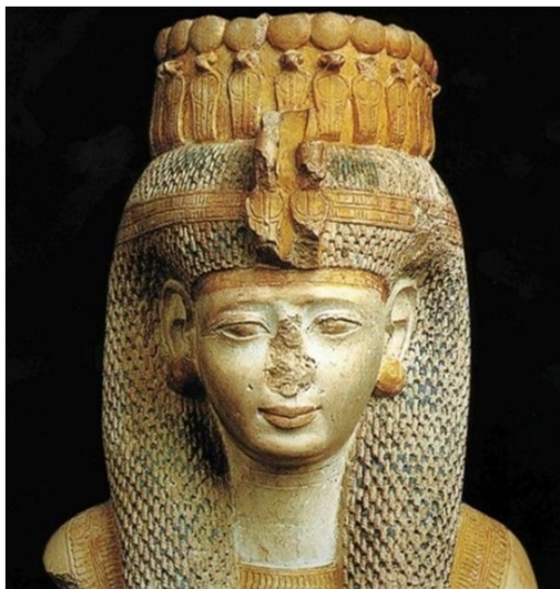
Merit Ptah, az i. e. 2700 körül élt első női gyógyító orvos és tudós

Olaszországban már a 13. században említenek nők által is látogatható orvosi iskolákat. Egyik nevesített kiválósága a főként sebészetben jeleskedő Trotula doktornő volt. Franciaországban viszont csak férfiak, közülük is csak a nőtlenek iratkozhattak be az egyetemre, ezzel hosszú időre olyannyira precedenst teremtve, hogy az angol V. Henrik király idejében (1413-1422) egyenesen börtönbüntetés járt a női gyógyítóknak.[13]