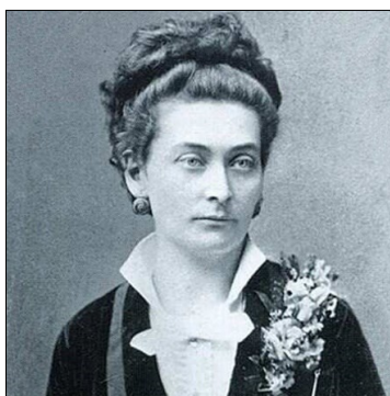
Hugonnai Vilma grófnő (1847-1922) – az első magyar orvosnő