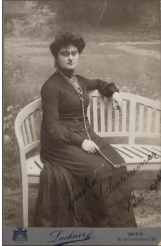
Bédy-Schwimmer Rózsa (1877-1948)