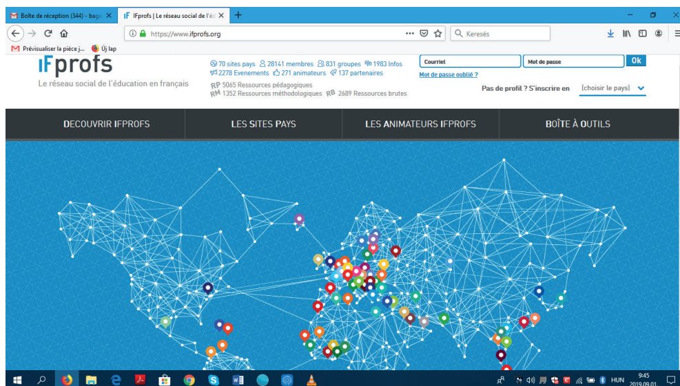
1. ábra. Az IFprofs kezdőlapja

Az IFprofs nevű közösségi portált a világban működő Francia Intézeteket irányító Párizsi Francia Intézet hozta létre és üzemelteti. A platform neve a következő részekből áll össze: IF = Institut Français (Francia Intézet) és profs a professeurs (tanárok) szó rövidítése. A Párizsi Francia Intézet több IF-fel kezdődő szolgáltatást is kínál, mint amelyen például az IFcinéma, amely francia filmek nem kereskedelmi céllal, iskolai, közösségi vetítését teszi lehetővé regisztrált intézményi felhasználói számára. A weboldal a következő címen érhető el: https://www.ifprofs.org/ .