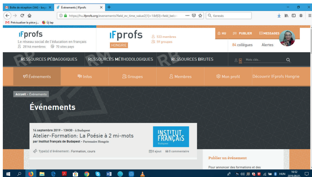
3. ábra. Az IFprofs Hongrie kezdőlapja

meg a kollégák, mert oktatási szempontból alkalmasnak találták ezeket egy későbbi didaktizálás számára. Itt van még a keresőmotor, ahol név szerint, országonként és kulcsszavak szerint is kereshetünk a különböző kategóriákban.