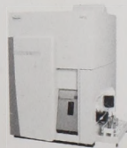
iCAP Q ICP-MS Kiemelkedő teljesítményre, termelékenységre és egyszerű használatra tervezve