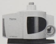
iCAP 7000 ICP-OES család Az elérhető legnagyobb teljesítményű ICP-OES megbízható rutin művelemes analízisre