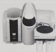
ICE 3000 AA család Innovatív dizájn, automatikus váltás a láng és grafitkémence üzemmódok között