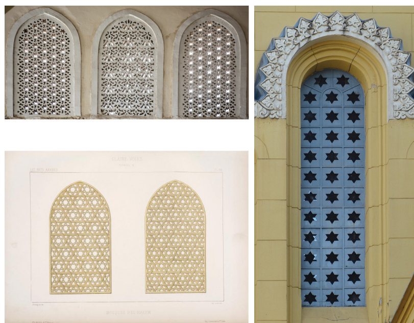
3. kép. Ablakrácsok: a) Kairó, Hakim Mecset, 10. század; b) Kairó, Hakim Mecset, Hessemmer mintakönyve; c) Fót, templom