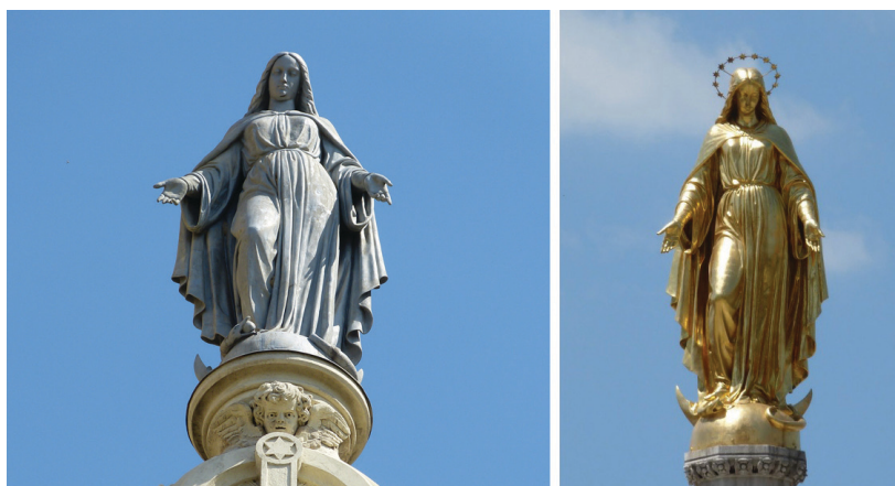
2. kép. Anton Dominik Fernkorn: Mária Immaculata szobor: a) Fót, templom; b) Zág-ráb, székesegyház előtti tér