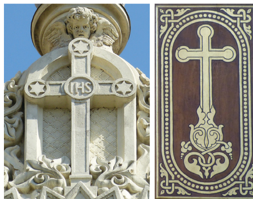
8. kép. Kereszt motívum szárvégein körbe írt hatágú csillaggal: a) A homlokzat oromfalán; b) A kapu belső oldalának középső mezői; c) A mellékoltárképek teteje; d) A mellékoltárképek hátoldala