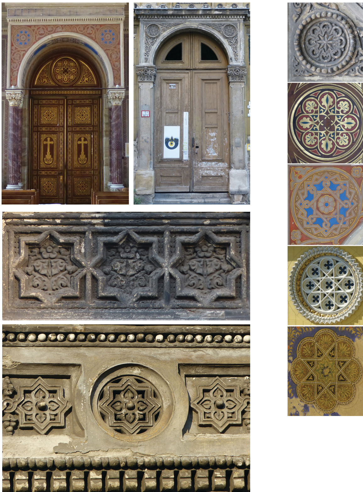
10. kép. A fóti templom kapuzat belső oldala és az Unger-ház Magyar utca felőli kapuja