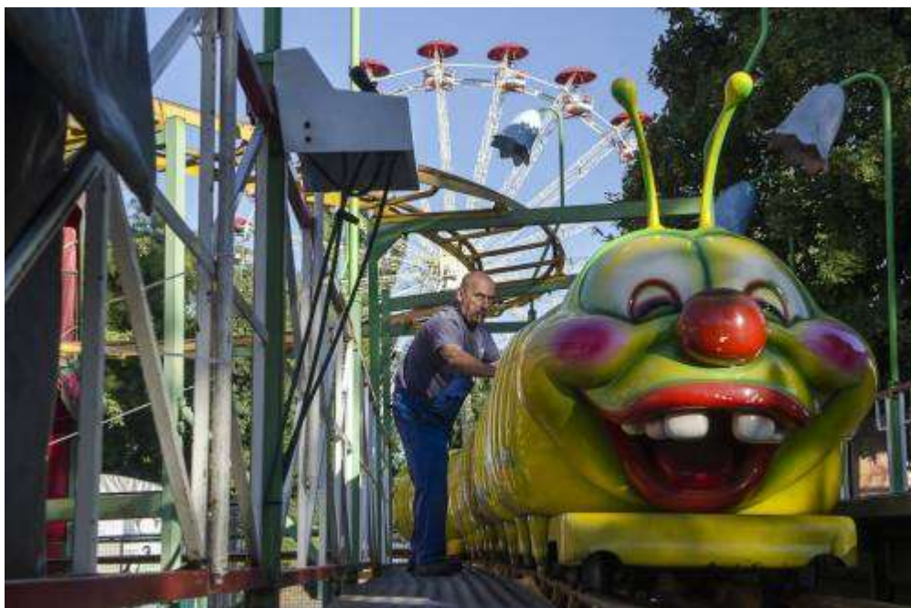
A Kukomotív (Hernyó) 1998 óta üzemel