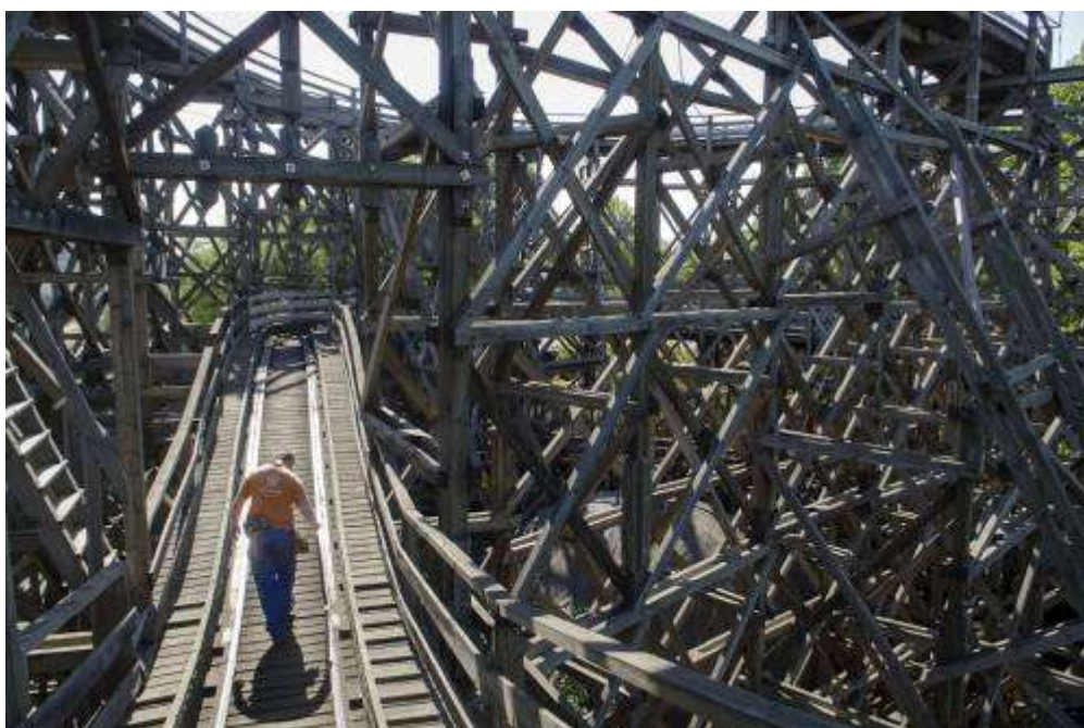
Pályahossza 1028 méter