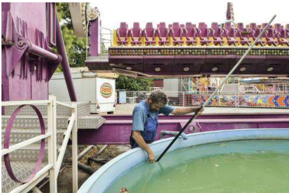
A Top Spin-en ülő látogatók zsebéből egy medencébe hullanak a pénzermék