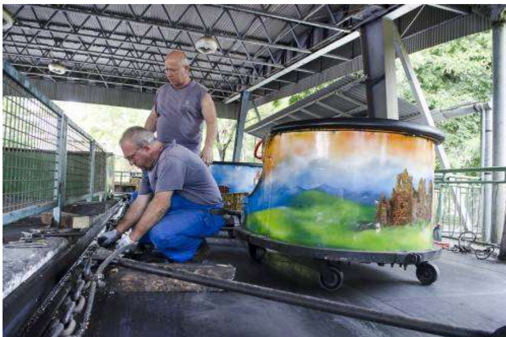
A Kanyargó egyik szerelvénye