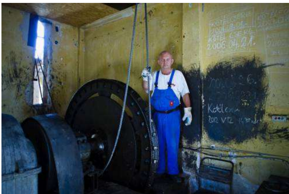
A Hullámvasút felhúzó gépezete