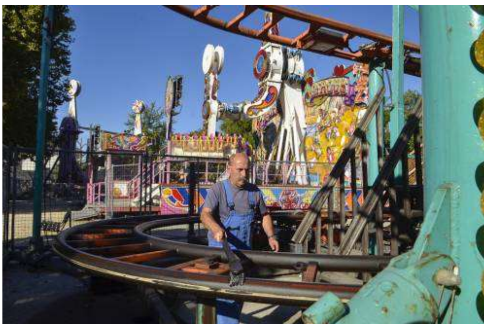
A Vidámpark legújabb játékainak egyike a 2010-ben üzembe helyezett Spinning Coaster, háttérben a Flying Circus