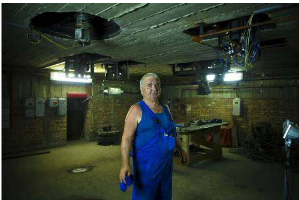
Az Elvarázsolt Kastély – amelynek elődje ugyancsak a Vidámpark egyik legrégebbi építménye 1912-ből – alatti szerkezetek