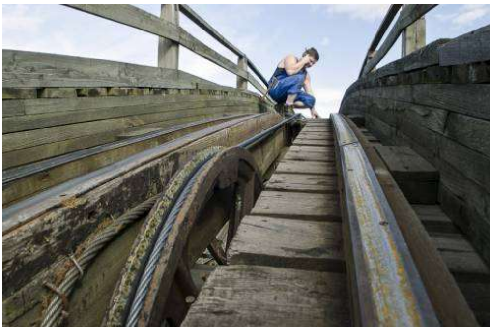
A szerkezet anyaga túlnyomórészt borovi fenyő