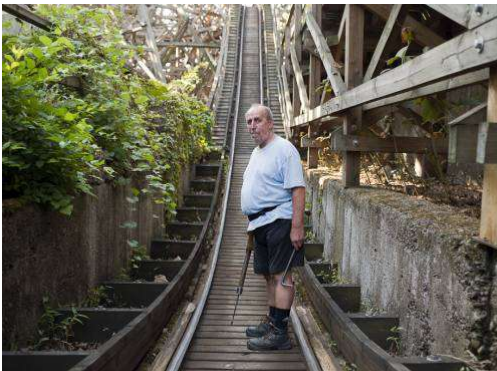
Az 1922-ben üzembe helyezett Hullámvasút