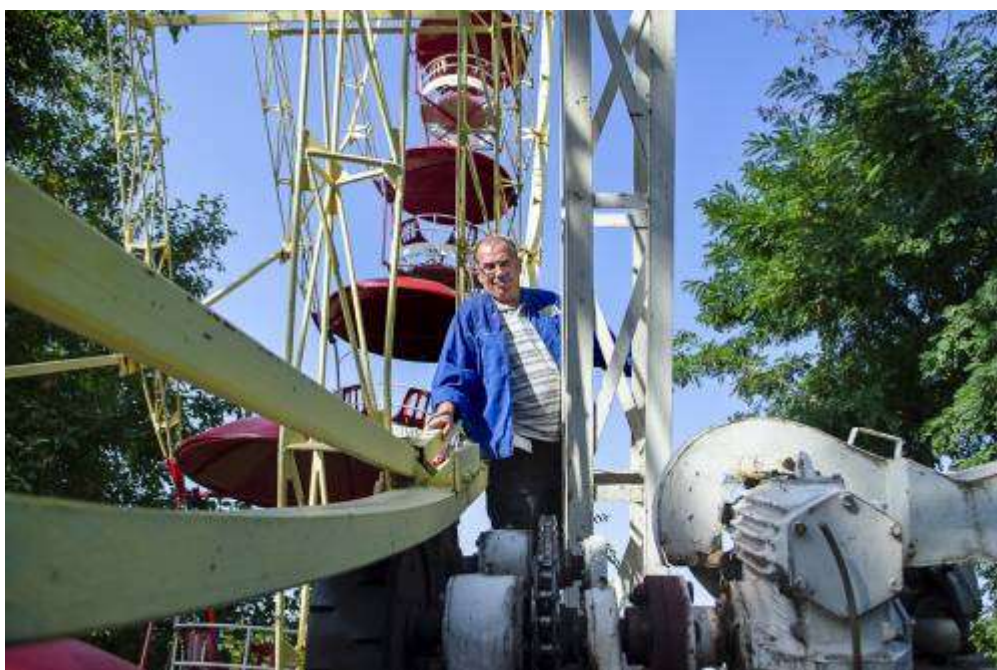
A 31 méter magas, 1974-ben üzembe állított Óriáskerék mozgató motorja