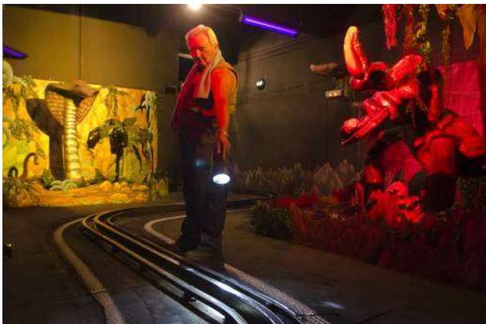
A Tréfás Dzsungel Vasút sínrendszere