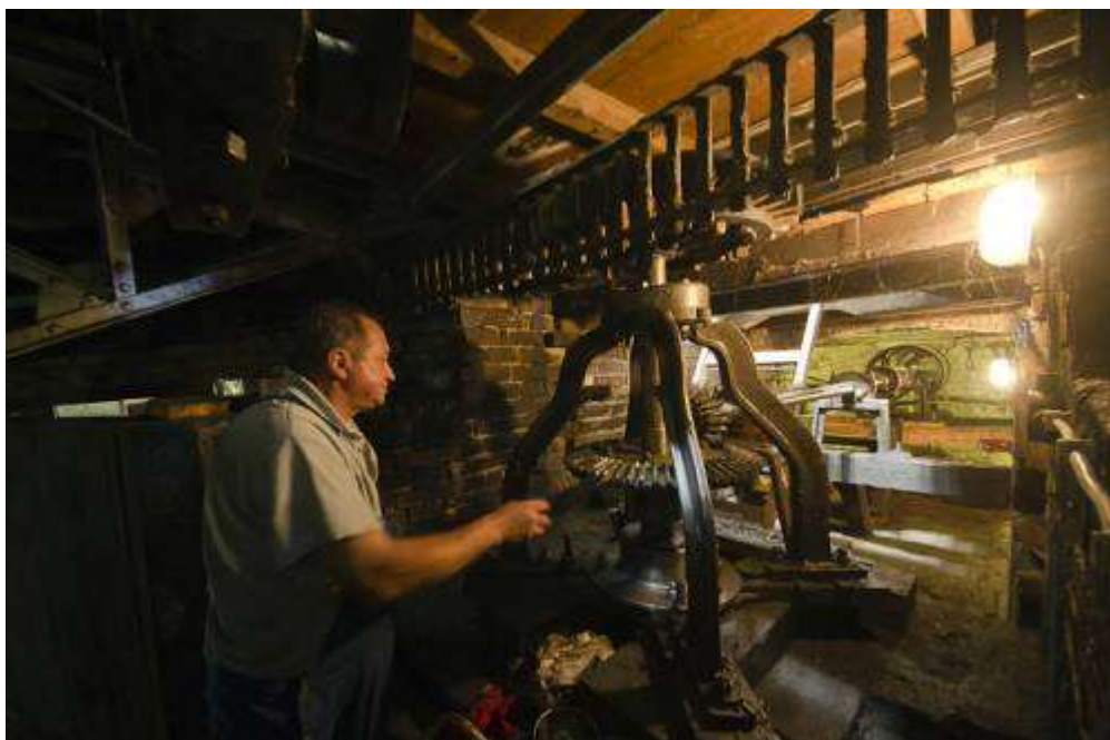
A Vidámpark egyik legrégebbi játéka, a valószínűsíthetően 1906 óta üzemelő körhinta alatti szerkezet