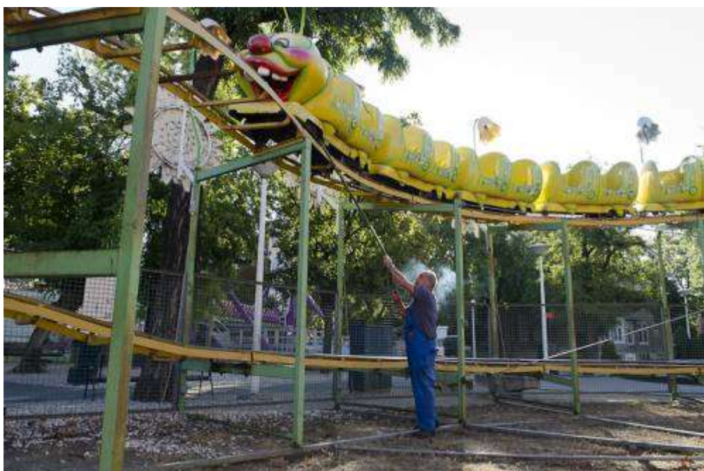
A Kukomotív egyszerre 24 főt tud szállítani három méteres magasságig