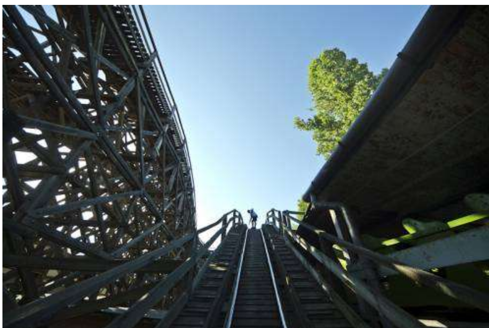
Szerelvényeit nem motor működteti, legnagyobb sebessége hozzávetőleg 40 és 50 km/h között van