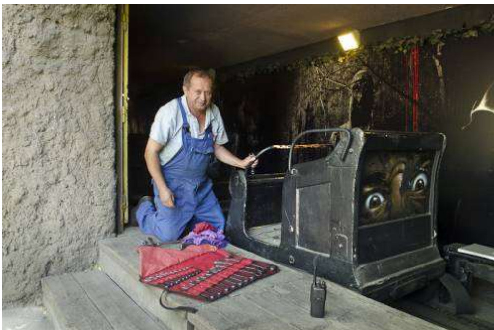
A Szellemvasút egyik kocsija