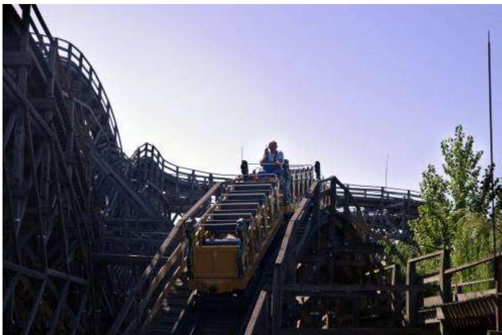
Fajtáját tekintve favázás szerkezetű kényszerpályás hullámvasút