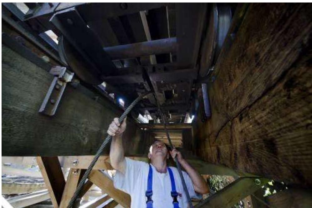
1997 óta áll műemlékvédelmi oltalom alatt