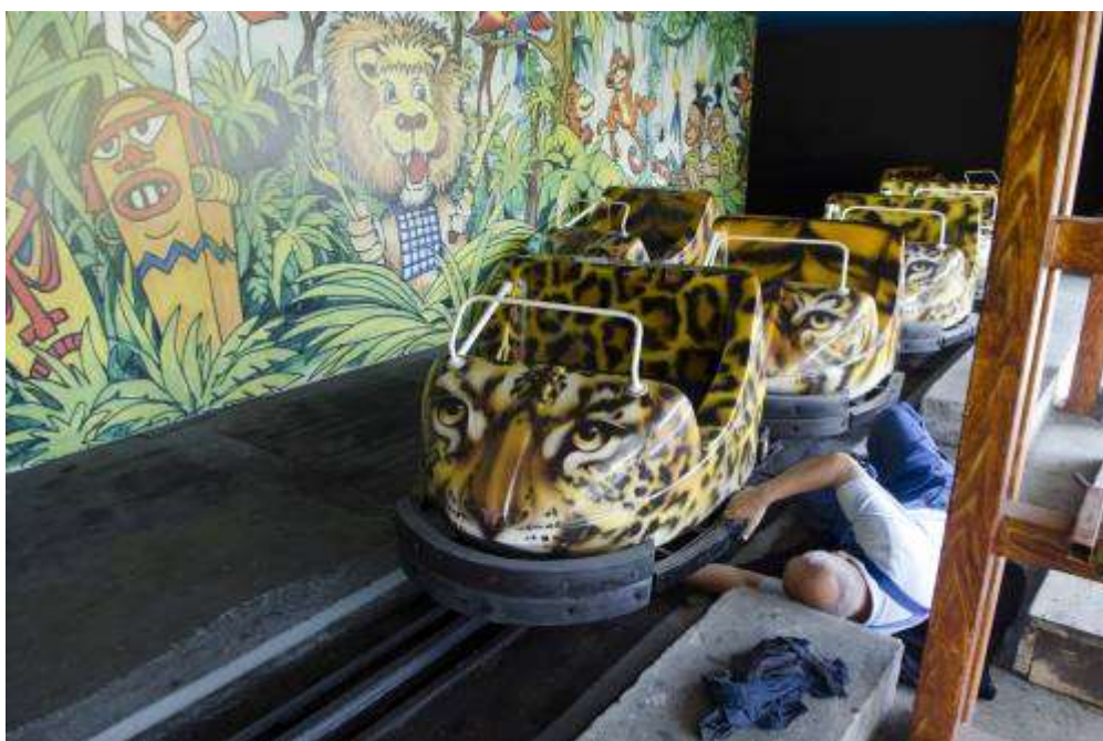
A Tréfás Dzsungel Vasút és a Dzsungel Mesepark többi játéka 2009 tavaszán került átadásra