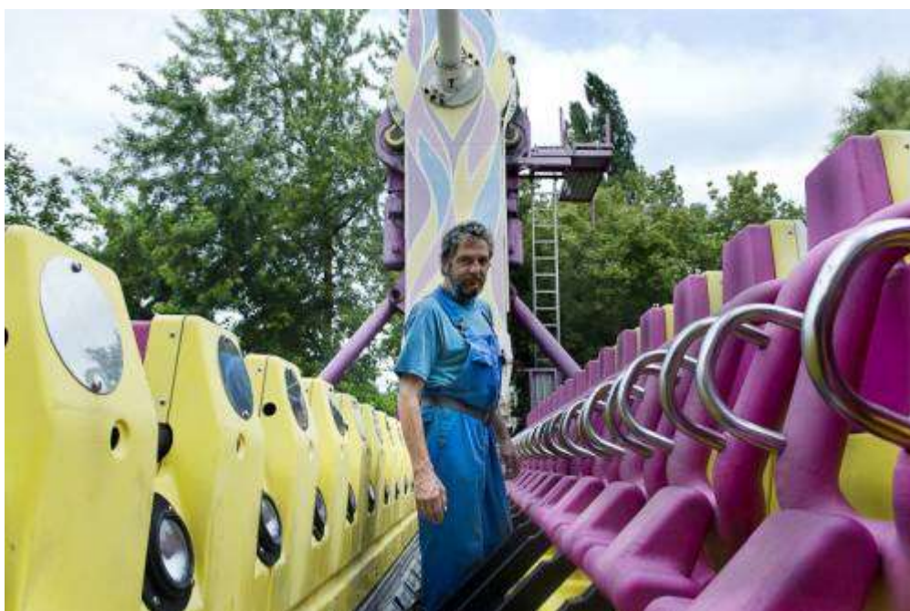
A Top Spin nevű játékon 18 méteres magasságból fejjel lefelé zuhanhat a látogató