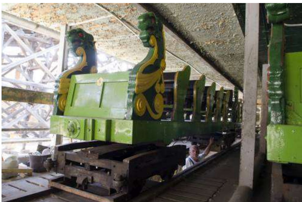
Szerelvényei színes sárkányokat mintáznak meg, amelyek rendszeres karbantartás mellett mindvégig az eredetiek maradtak