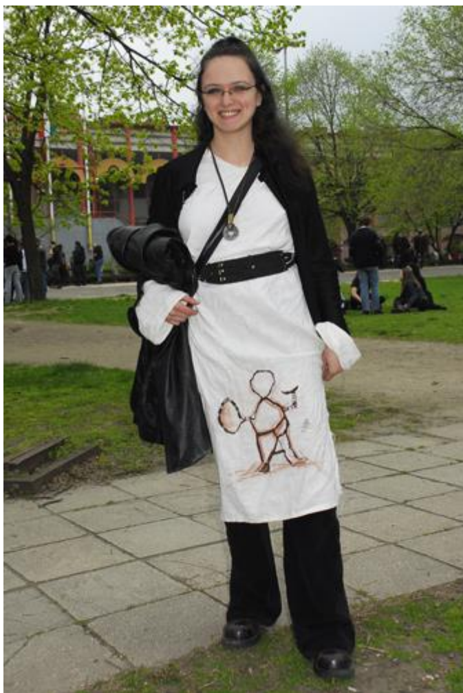
1. kép: Lány egy saját maga által készített ruhában, rajta a Korpiklaani sámándobja Paganfest, Budapest, 2008 Sarnyai Krisztina felvétele Néprajzi Múzeum F 337005