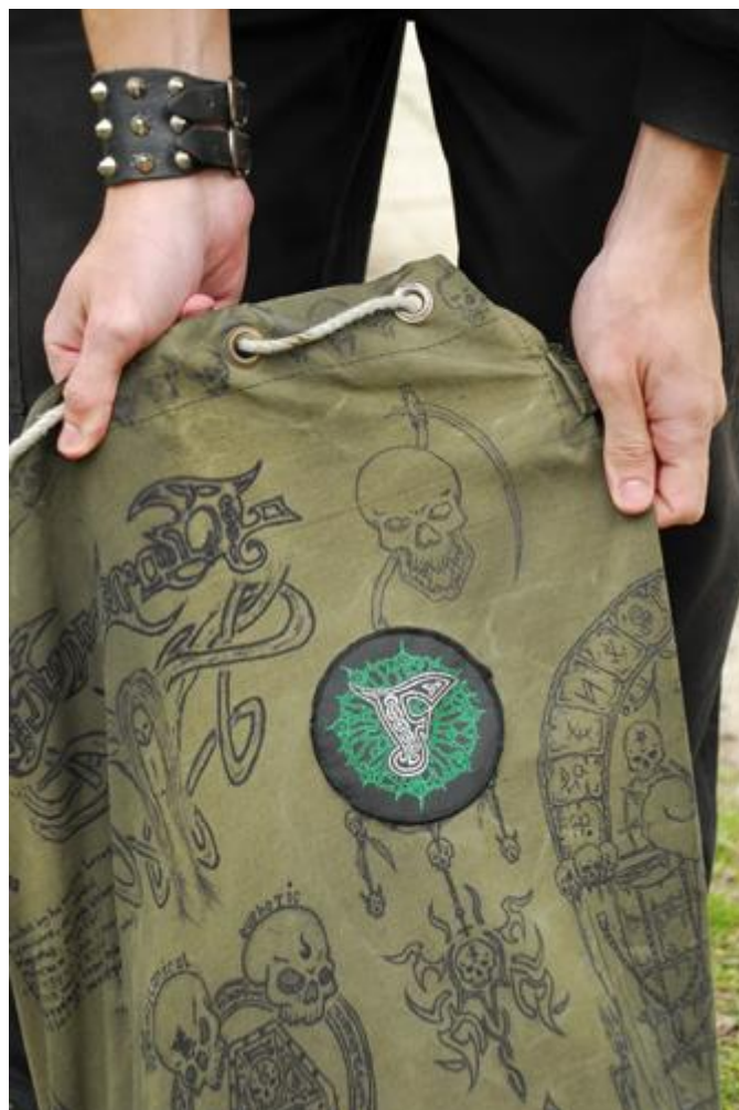
2. kép: Finntroll logó egy hátizsákon Paganfest, Budapest, 2008 Sarnyai Krisztina felvétele Néprajzi Múzeum F 337782