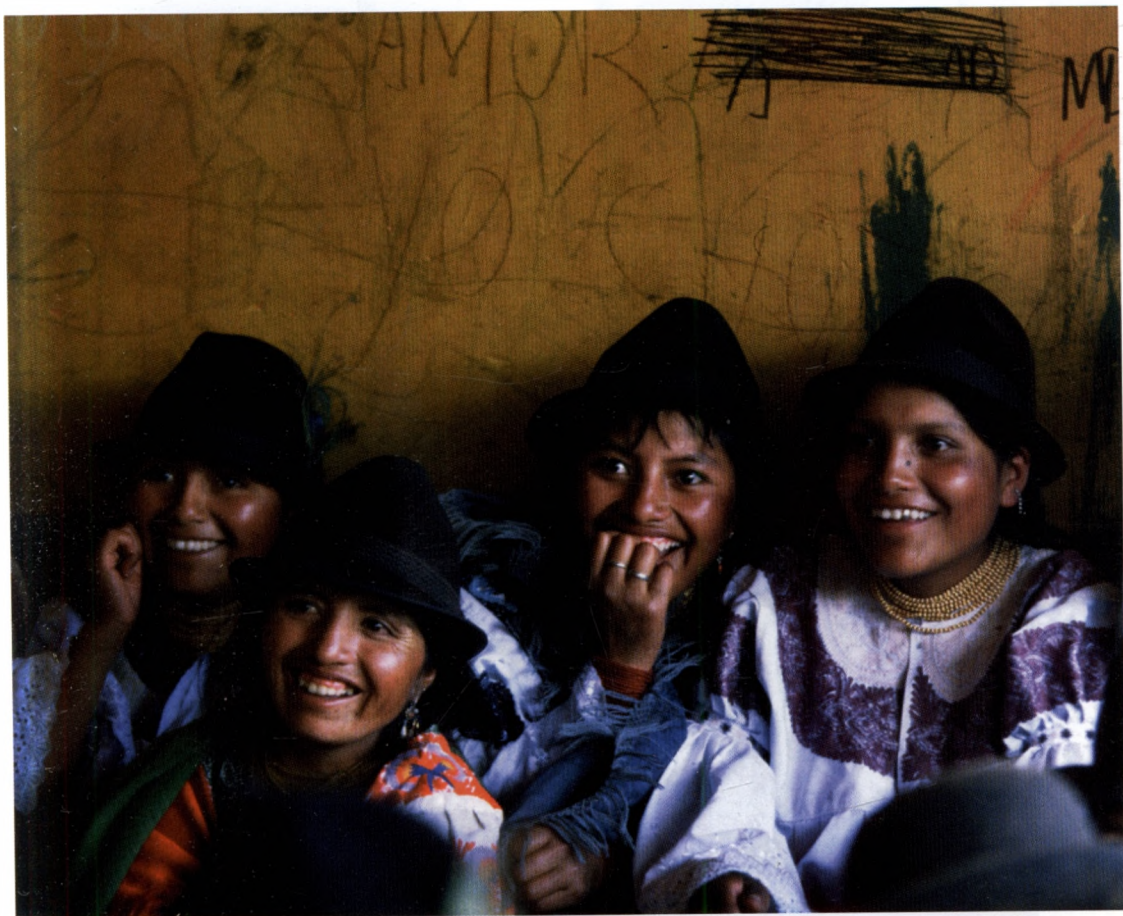
Az előadás sikeres