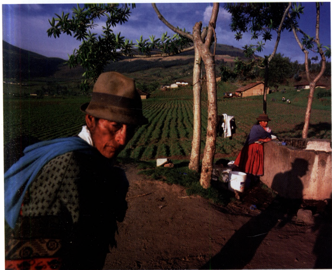
Kecsua porta az Andok völgyében

Magyarországi kulturális örökségvédelmi hatóságok által támogatott projekt