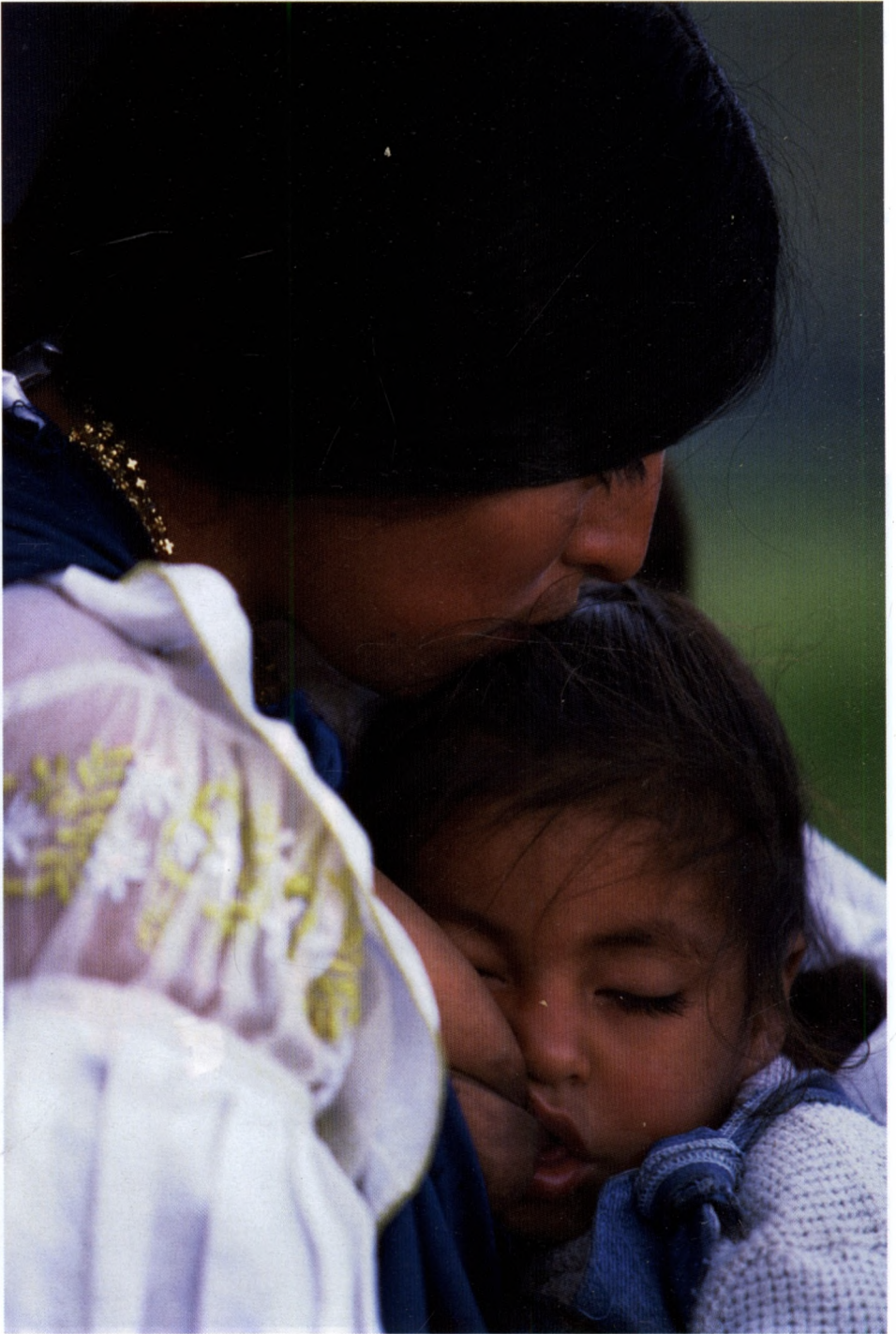
A kecsua anyák gyermekeiket általában hároméves korukig szoptatják