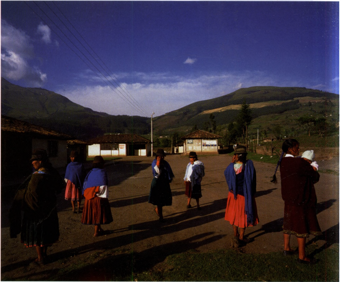
A faluközösség „agórája”