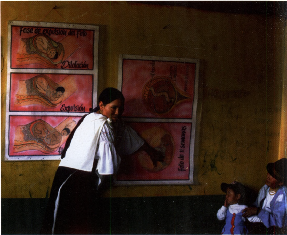
A Jambi Huasi bábája felvilágosítást tart a sokgyermekes kecsua anyáknak