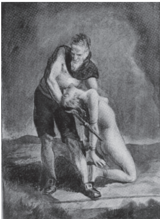
1. kép Brenner Nándor színes műmelléklete Havas Károly Az inkvizíció története című munkájában

rális igénnyel kidolgozva ábrázolják a boszorkányüldözött és áldozatát (Havas 1927). Ezekből az egyiken a hóhér kéjes mosollyal köt gúzsba egy meztelenre vetkőztetett fiatal nőt (Havas 1927:97; lásd 1. sz. kép), a másikon egy ugyancsak meztelen nőt a kínzóasztalhoz béklyóztatva csigáznak, míg egy hóhérsegéd a szájába egy tölcséren keresztül vizet tölt. Az ilyen és ehhez hasonló munkák inkább szolgálták a szexuális kíváncsiság kielégítését, mint egy korszerű történetírás igényeit. A feminista történetírás ennek a torz képnek a revidálását tűzte ki célul. Az eredmény azonban a boszorkányüldözés működésének feltárása helyett a 19–20. század nőkről vallott történetírói és köznapi szemléletének megkérdőjelezése, a valós események kritikai feltárása helyett a valós eseményekről alkotott fikció kritikája lett. A kritika persze jogos volt. Az a bizonyos „csata” tehát nem a férfi boszorkányüldöző és a női boszorkány, hanem – egy kicsit sarkítva – a hagyományosan férfiműfajnak tekintett történetírás férfiúi és a kialakuló új, emancipált történetírzgeneráció női tagjai között zajlott, zajlik. A harc eredményeként pedig beköszöntött a történetírásban – amit Laqueur a női test kapcsán mondott – a „két nem”-modell korszaka.