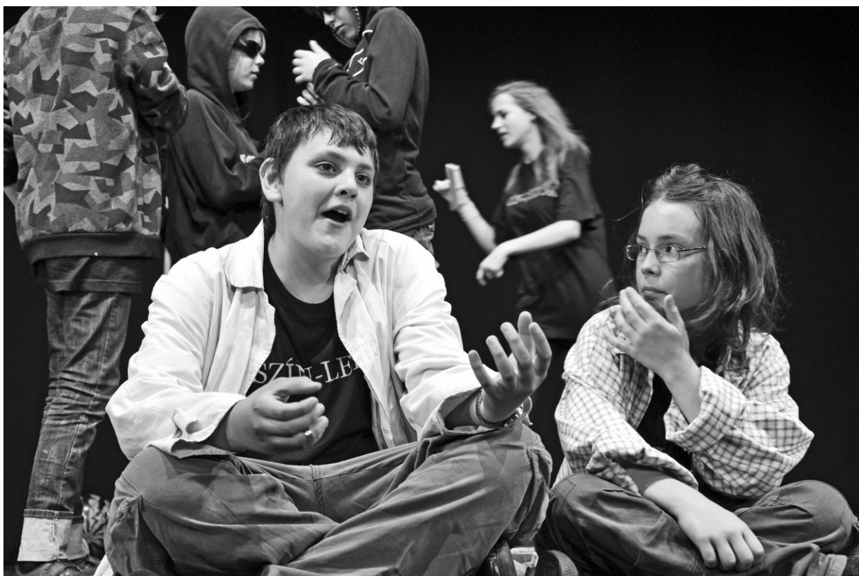
7. kép: Prücsök (az átverés vígjátéka két részben, avagy a fagyvi visszanyal). A kecskeméti Szín-lelők előadása. Rendezte Sz. Kulcsár Gabriella.

mint a mesében, itt is elnyeri a főhős méltó jutalmát, miközben a csoporttal együtt mindannyian sejtjük a nézőtérre, hogy mindez egyáltalán nem áll olyan messze a valóságtól.