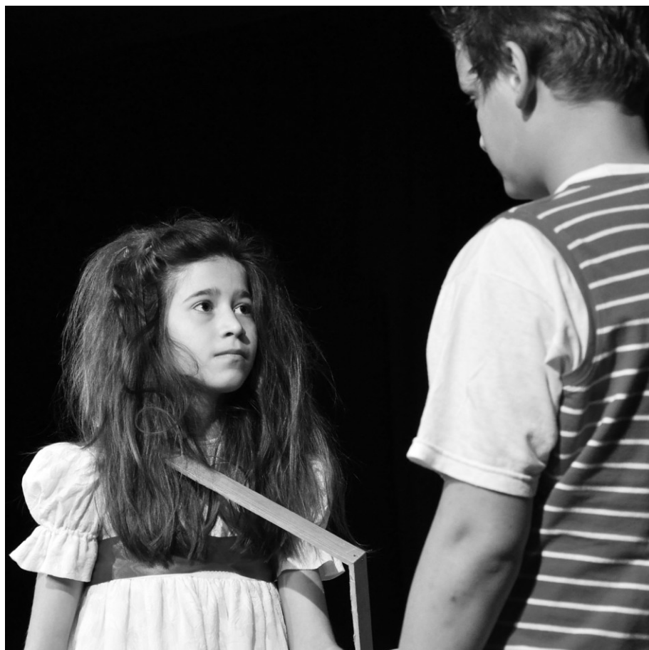
1. kép: Babaarcú démonok. A Budavári Buzaszemek előadása. Rendezte Buza Tímea

Varró szövegét. A Babaarcú démon szerepére kiválasztott leányka játékában képes arra, hogy a kötelező velőtrázó kacajt visszafogottan, mégis valami mély fájdalmat sugárzóan mutassa meg számunkra. A nagybácsit játszó fiú izgalmas színfoltja az előadásnak. A rendező mértéktartását és színházérzékenységét jelzi az ő játéka is. A tragikus sorsú őst fanyar öniróniával, fásult közönnyel formálja meg a szöveg által