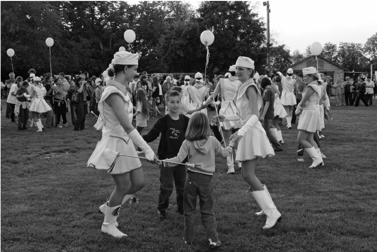
5. kép: Gyulán gazdag kiegészítő-szórakoztató programot kaptak a regionális bemutató résztvevői.