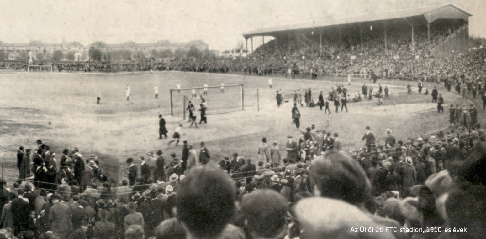
Az Üllői úti FTC-stadion, 1910-es évek

futballistájának civil pályafutása: mindannyian legalább érettségizettek voltak, többségük hivatalnokként vagy mérnökként dolgozott.