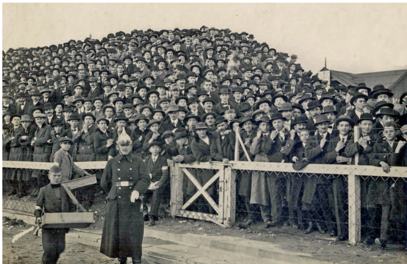
A Budapest–Berlin találkozó állóhelyi közönsége az Üllői úton, 1913

a szövetség elnöksége részletes figyelemztetést adott ki. Ezúttal is arra intették a játékosokat, hogy ne veszélyeztessék ellenfelük testi épségét, ugyanakkor az MLSZ a közönséget is figyelmeztette, hogy „magatartásával ne izgassa fel a játékosokat és ne biztassa őket egymás ellen, mert ezen viselkedésük esetleg súlyos következményekkel járhat arra az egyletre nézve, amelynek érdekeit szolgálni akarják”.