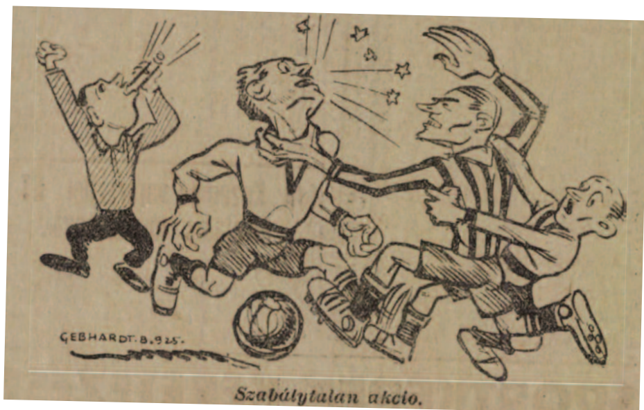
Szabálytalan akció. Sporthírlap , 1926. január 18.

sége égő rakétákat dobált a pályára, hogy a KAOE-t akadályozza a játékban". Sőt, már bírót is ért támadás, a TTC-