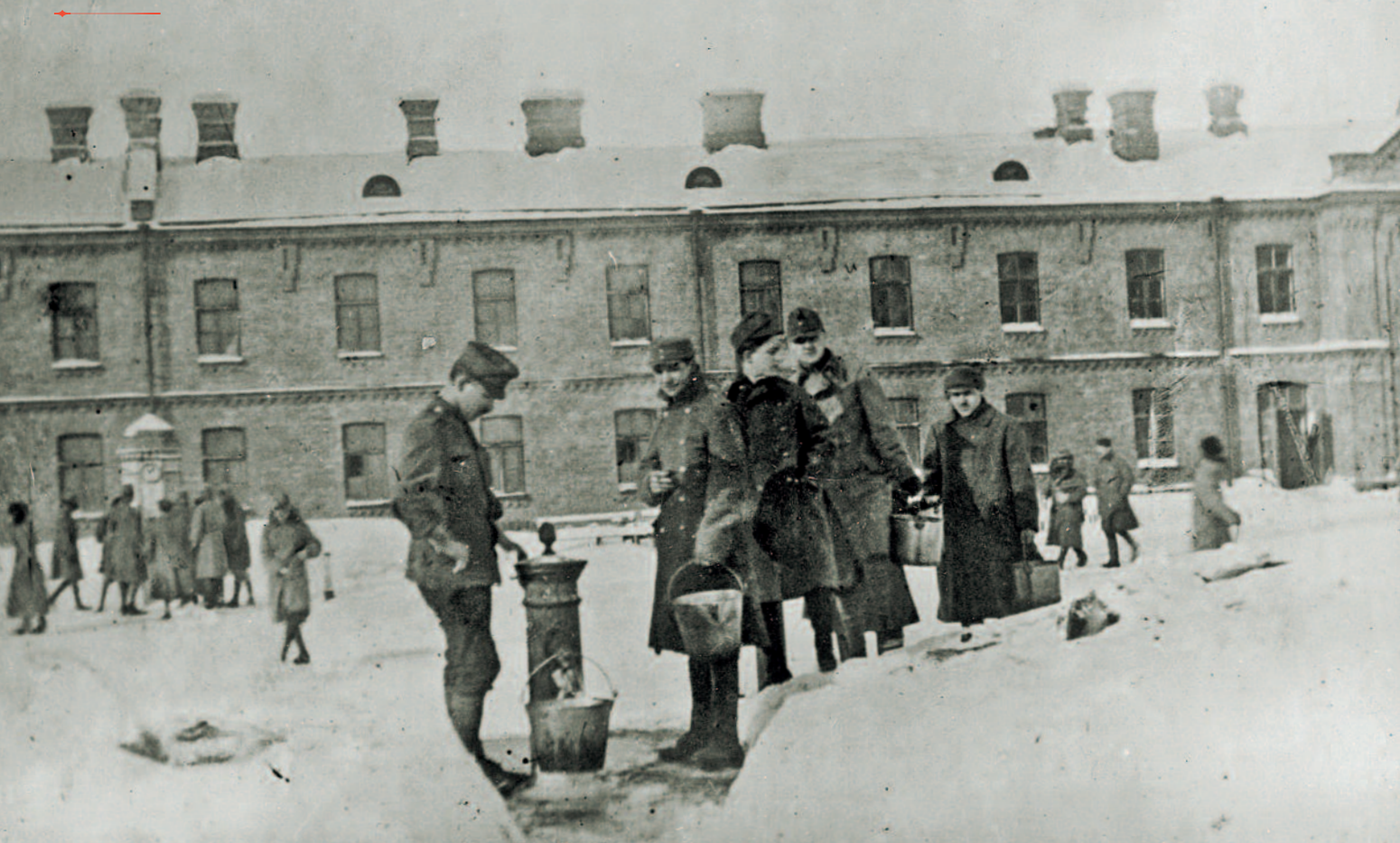
Vízfordás a krasznojarszki lágerben – télen, az akár mínusz 30-40 fokos hidegben nagy kincsnek számított a teafőzéshez használt kútvíz

gyobb ütközetek után a hiányzó katonák számát megállapították ugyan, de nem tisztázták, hogy ezek a katonák meghaltak-e vagy foglyotáborba kerültek. Az orosz hivatalok regisztrálási módszere csak tovább bonyolította a kérdést: sokakat nem regisztráltak azonnal, ellenben jó néhány katonát többféle névváltozaton szerepeltettek (pl. a Balázs vezetéknevűek Balász vagy Balásza, a Horváth vezetéknevűek pedig – mivel az orosz nem ismeri a szó eleji H-t a neveknél – Gorvat néven kerülhettek rögzítésre). Ezt nehezíti még az a tényező, hogy a hadifoglyok táborról táborra vándoroltak. Annyi bizonyos, hogy az Oroszországban lévő hadifoglyok 80-85%-a az egykori Osztrák–Magyar Monarchia állampolgára volt. Elsa Brändström vöröskeresztes ápolónő, akinek a foglyok a „szibériai angyal” nevet adták, félmillióra becsülte a magyarok és kétszázezerre az osztrákok számát – miközben a már említett Hadifogoly magyarok története szerint 1918. október végéig hét-