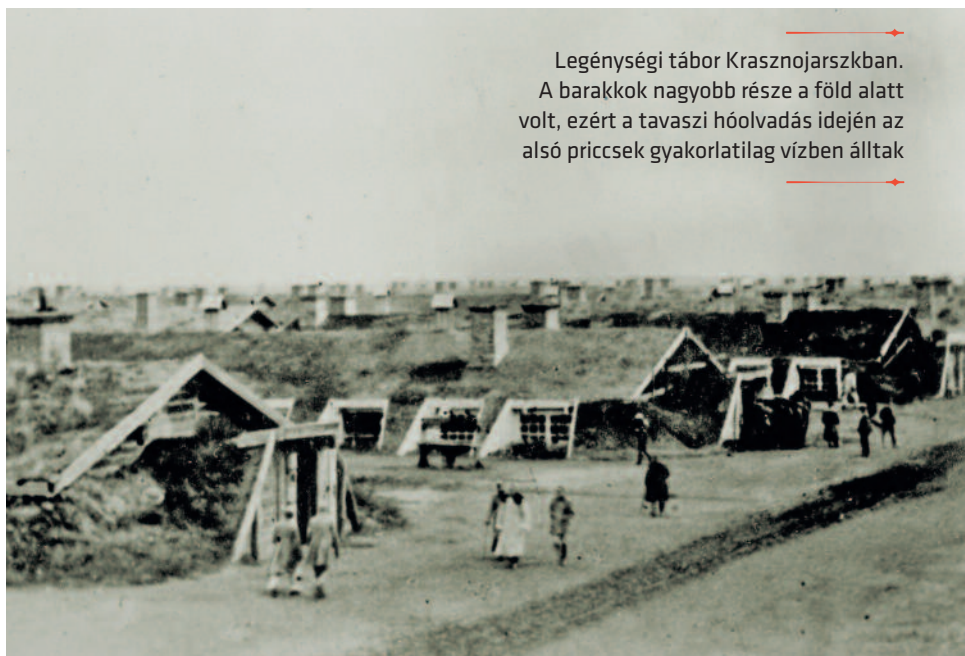
Legénységi tábor Krasnojarszkban. A barakkok nagyobb része a föld alatt volt, ezért a tavaszi hóolvadás idején az alsó priccsek gyakorlatilag vízben álltak

tek még egy csillagot egyenruhájuk galérljára – így önkényes kinevezésüknek köszönhetően a tiszti táborban nyervek elhelyezést.