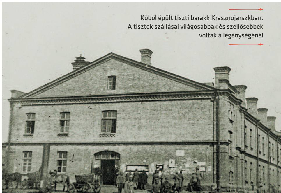
Kőből épült tiszti barakk Krasnojarszkban. A tisztek szállásai világosabbak és szellősebbek voltak a legénységénél

A néha hetekig tartó utazás során osztották szét a foglyokat katonai rendfokozat szerint külön táborokba – azaz szétválasztották a legénységet és a tiszteket. A tiszti táborok ellátása és általában a tiszti szállások sokkal jobbak voltak, mint a legénységiek, ezért a tisztjelöltek lázas igyekezettel hímez-