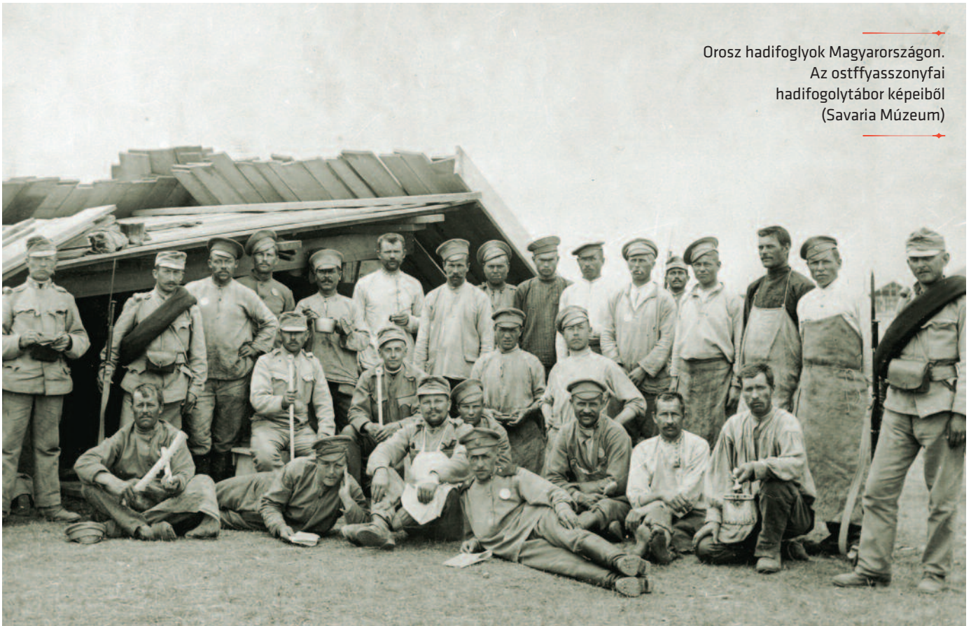
Orosz hadifoglyok Magyarországon. Az ostffyasszonyfai hadifoglytábor képeiből (Savaria Múzeum)

A már elkészült táborok azonban nem bizonyultak elegendőnek a hadifoglyok elhelyezésére, így 1915 tavaszán Zalaegerszegen, Ostffyasszonyfán és a Veszprém megyei Csóton újabb táborok építésébe kezdtek. Ezek már technikailag sokkal korszerűbbek voltak, mint a környékbeli települések: önálló vízvezetékkel és csatornarendszerrel rendelkeztek, „utcáikon” közvilágítás volt, a fűthető barakkokat pedig szabályos alakzatban, egymástól jelentős távolságra építették. A táborokat