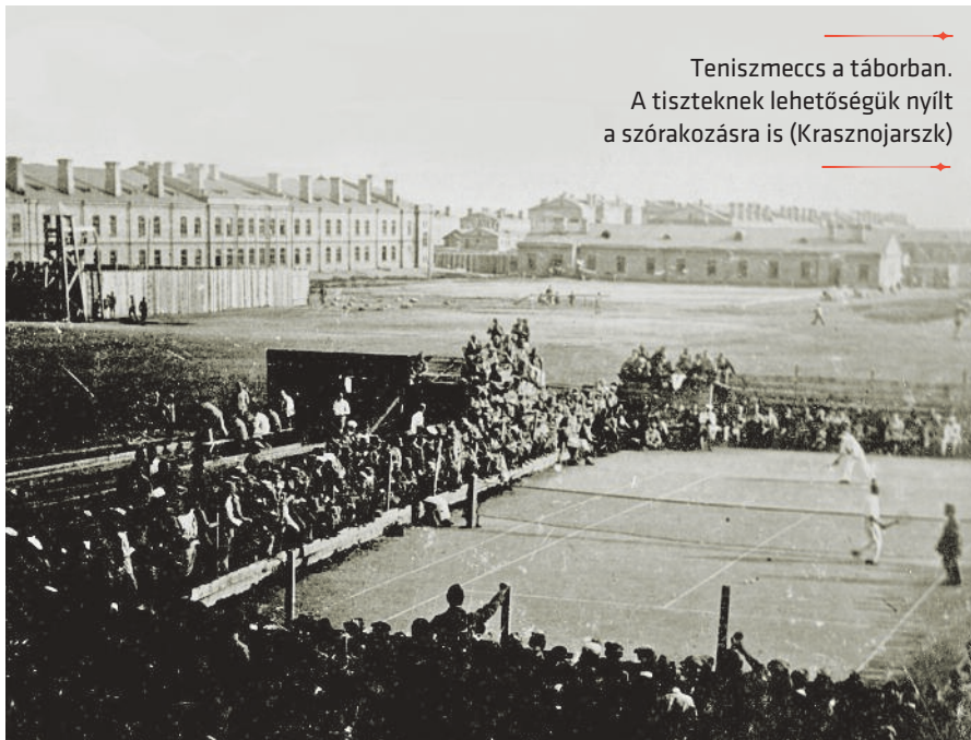
Teniszmeccs a táborban. A tiszteknek lehetőségük nyílt a szórakozásra is (Krasznajarszk)

A koszt sem volt kielégítő: a tea, a fekete kenyér, a káposzta és a kása mellett alig színesítette valami az étlapot, állan-