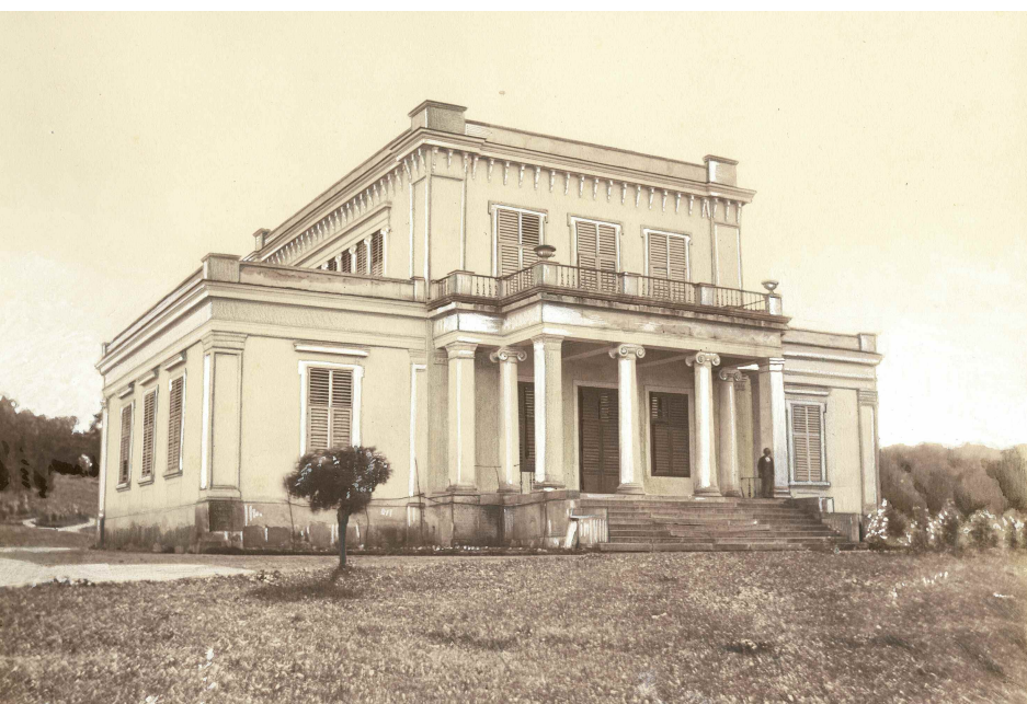
A Mikó-villa (Veress Ferenc felvétele, 1859) ➔