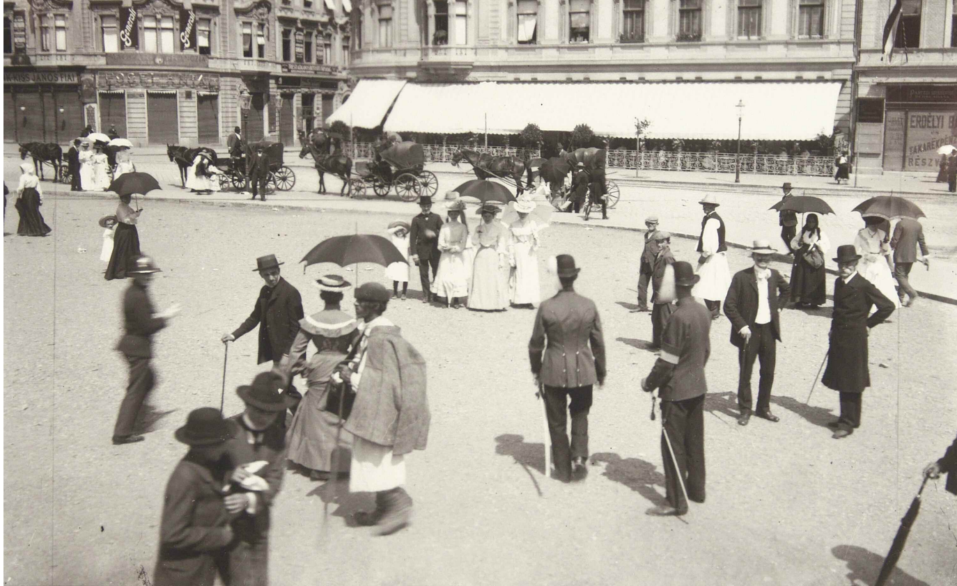
Déli korzó a Mátyás király téren, 1910 körül