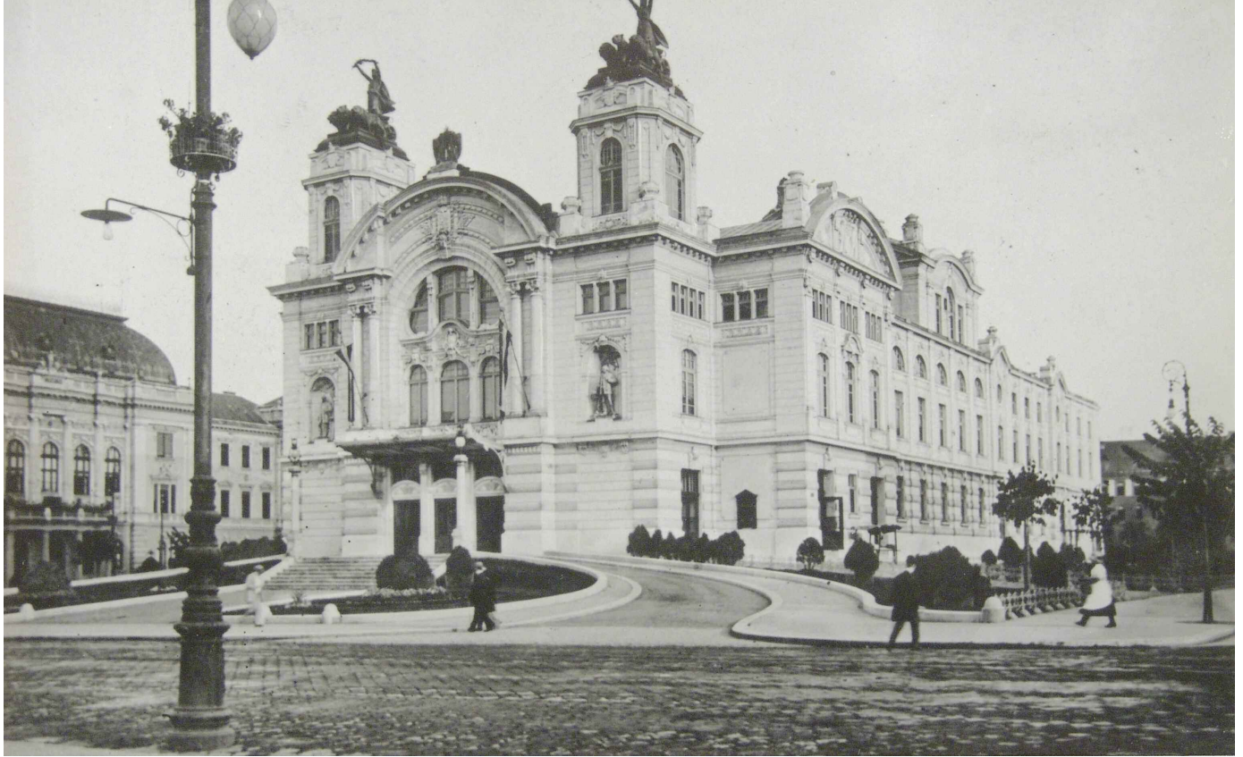
A Nemzeti Színház, 1920 körül