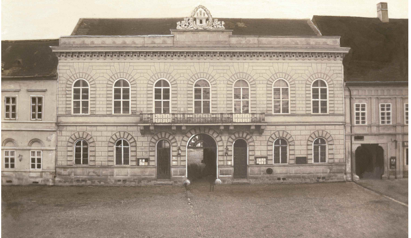
A városháza (status) épülete (Veress Ferenc felvétele, 1859)

hogy a 19. század második felében a korábbi egyemeletes keleti és nyugati házsorot ráépítéssel nagyrészt kétemeletes-sé növelték, ami – ugyancsak Kós Károly megállapítása szerint – nem zavarta meg a „ belvárosi központi piactér páratlanul harmonikus egységét ”.