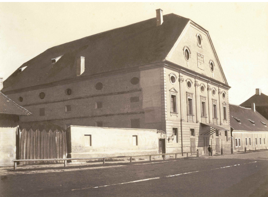
A Farkas utcai régi színház épülete ➔