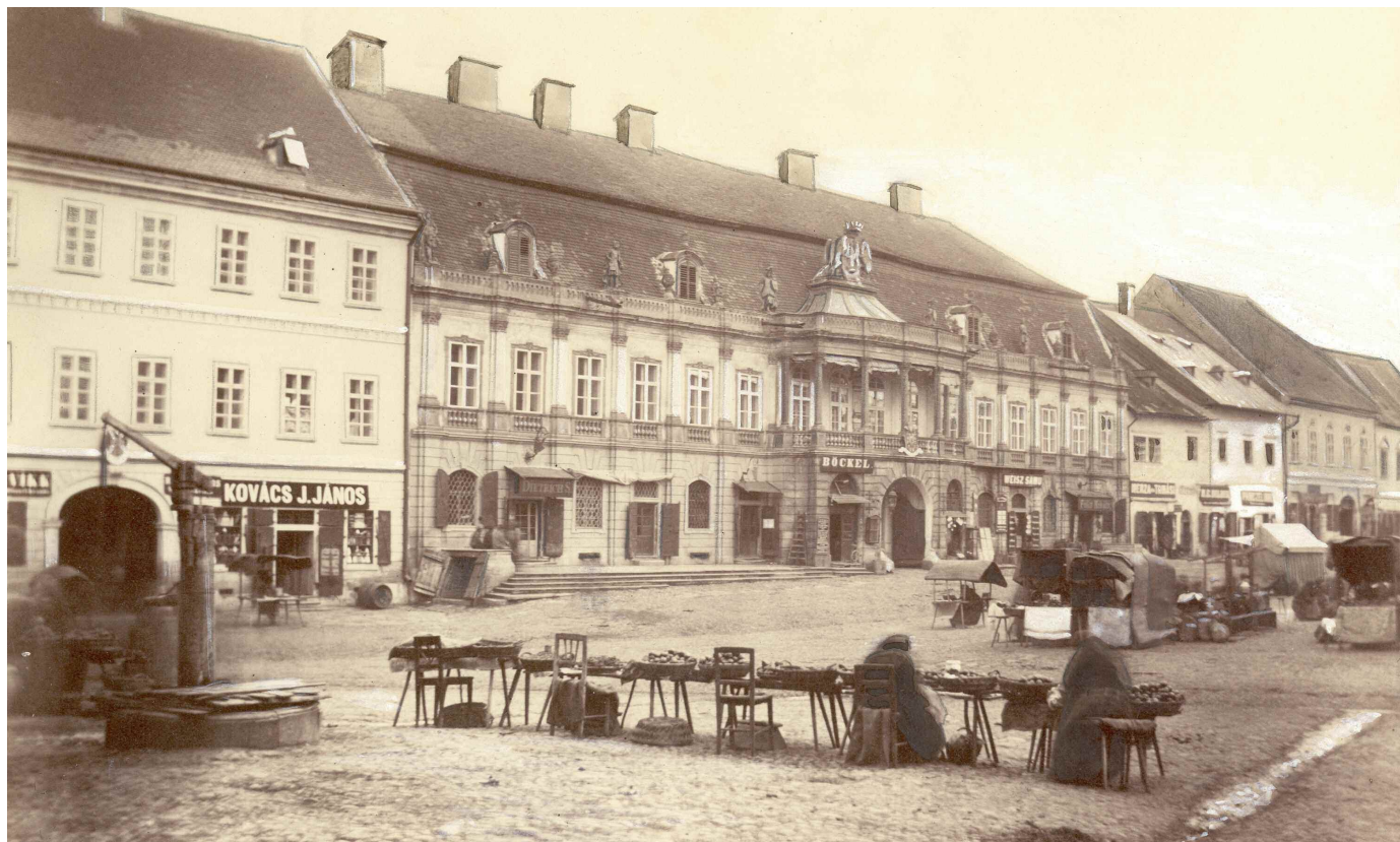
A főtéri Bánffy-palota (1859)

A Szent Mihály-templom körül az idők folyamán keletkezett bazárszerű épülethalmaz eltávolításának terve már a 18. század végén felmerült, de csak a 19. század végére fejeződött be az összes építmény lebontása. Ezzel Kolozsvár főtere sokat nyert, nagyvárosiassá vált. Előmozdította ezt az is,