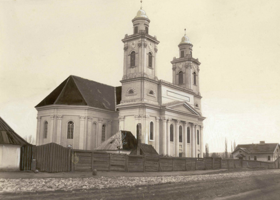
Az egykori Kül-Magyar utcai kétágú református templom (Veress Ferenc felvétele, 1859) ➔