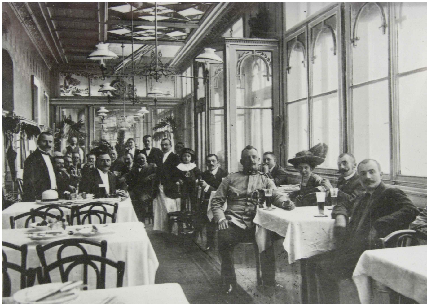
A Rác vendéglő, 1910 körül