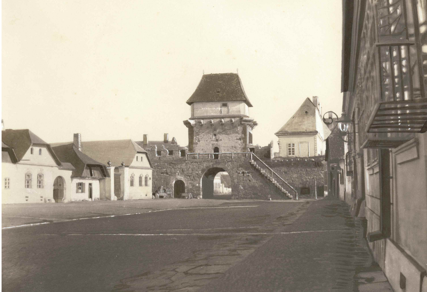
A Magyar utcai kaputorony (Veress Ferenc felvétele, 1859)

városok voltak a színhelyei. Mint ismeretes, az állandó színház épületét 1821-ben adták át rendeltetésének a Farkas utcában. Ettől kezdve a vidéki érdeklődők is egyre gyakrabban utaztak színházi estekre Kolozsvárra, s a Magyarországról jövőeknek – amint azt gazdag úti irodalom bizonyítja – gyakran volt itt maradandó színházi élményben részesük. Lehetetlen tehát nem látnunk, hogy a kolozsvári színház a különböző tájakon, vidékeken és a két testvérországban élő magyarság között összekötő kapocs is volt.