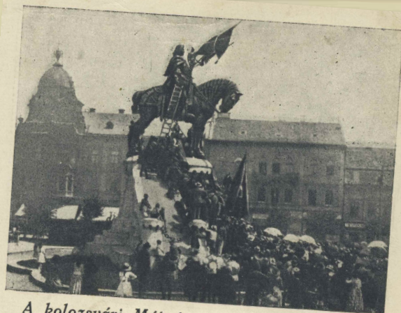
A kolozsvári Mátyás-szobor meggyalázása.

örökkévalóságát teremteték meg. A magyar szobrászat első, valóban monumentális műve határozottan uralja a polgárházak és paloták, illetve a középkort felidéző Szent Mihály-templom által közrezárt teret. Az egységes, zárt kompozíciójú szoborcsoport meghatározó figurája Mátyás király, aki előtt legendás hadvezérei tisztelegnek a győztes csatákban zsákmányolt zászlókkal. Itt nem a mecénás vagy a mesék Mátyása jelenik meg, hanem a magyar nemzetet győzelemre vezető katonakirály alakja. Az erőt csak fokozzák a masszív talapzat bástya-elemei, amelynek kivitelezésével Kolozsvár főépítészt, Pákey Lajost bízták meg.