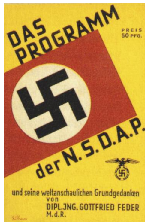
Az NSDAP programját tartalmazó brosúra

A fogalom többnyire Adolf Hitler és hívei sajátos ideológiáját jelenti. A „nemzeti” kifejezés alatt Hitler az egyén felelősségét értette a népközösségben, amelynek az egyénért vállalt felelősségét nevezte „szocializmusnak”. A szocialisták fő céljával, a termelési eszközök társadalmasításával azonban szembe szállt. Hans-Ulrich Wehler történész szerint a szocializmus az NSDAP-ben