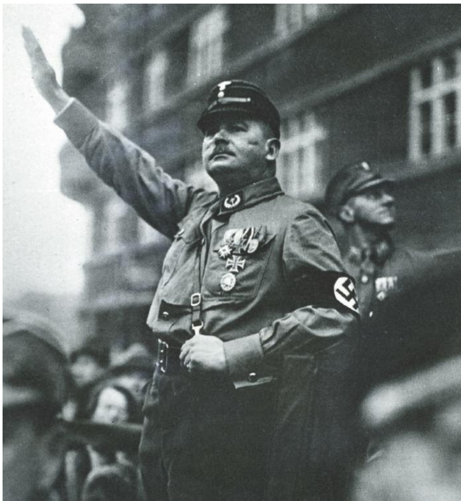
Ernst Röhm mint az SA főparancsnoka

vénnyé változtatták és koporsóját horogkeresztes zászlóval fedték le. Az SA sorfalat állt, és sírjánál vezető náci búcsúztatták. Horst Wessel az NSDAP számára kettős szimbólum lett: a halálával a vétlenül üldözött párt képét sugallták a közvéleménynek, befelé azonban példaképül szolgált hívek számára, és „szellemét” a mozgalomban folyamatosan ébren tartották. Maga Hitler is támogatta Wessel mítoszának építését.