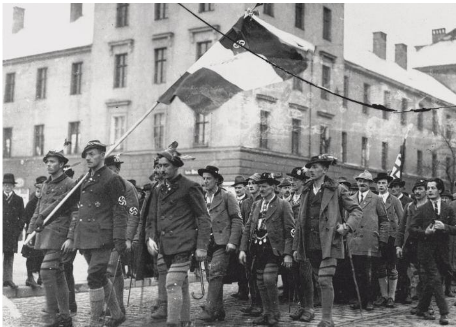
Bajor szabadcsapatok Münchenben, 1919

eszközök a számos korábbi gyűjtőmozgalomhoz hasonlóan továbbra is tisztázatlanok maradtak.