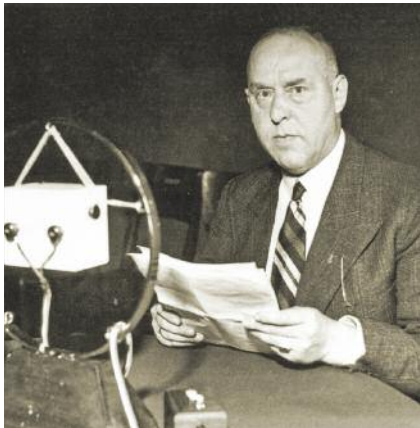
Gregor (fent) és Otto (jobbra) Strasser

dalom „ csapásról csapásra ” halad tovább, „ s nem fog megállni, amíg az egész Német Birodalmat nem hódította meg ”. Röhmhöz hasonlóan az SA-t az SS-szel együtt – a Reichswehr és a rendőrség mellett – az állam harmadik hatalmi tényezőjének tartotta.