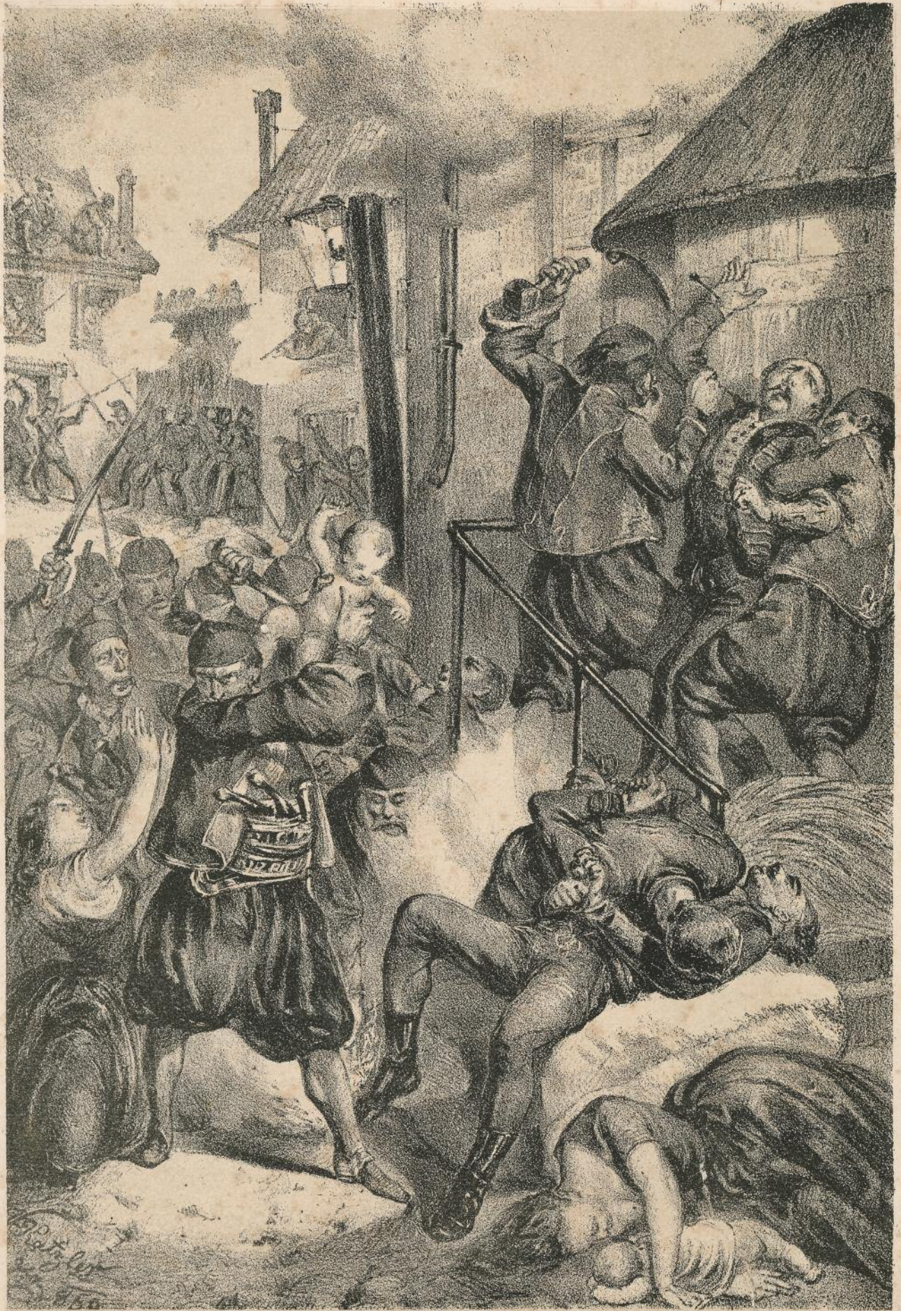
La Crudeltà dei Serbiani contro i Tedeschi Weiskirchen nel Banato.