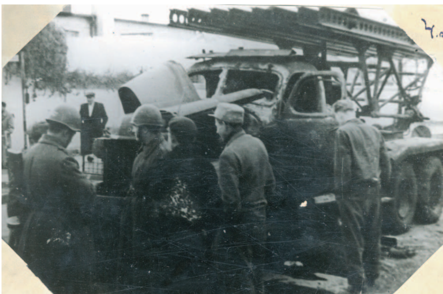
A Juta-dombon kilőtt szovjet sorozatvetők