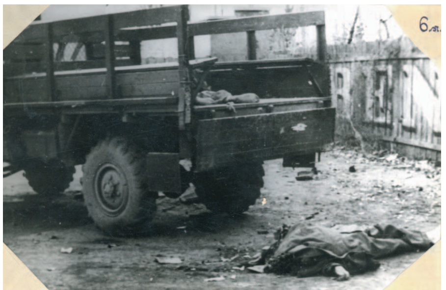
A Juta-dombon kilőtt szovjet tehergépkocsi