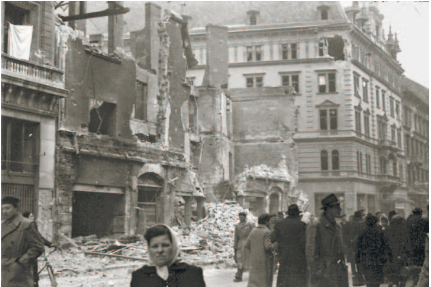
Szétlőtt ház a Rákóczi út és az Osvát utca sarkán

csolatban a régóta rács mögött ülő személyek a tárgyalások során testi fenytésre és kényszerítésre hivatkozással sorra vonták vissza vallomásaikat.