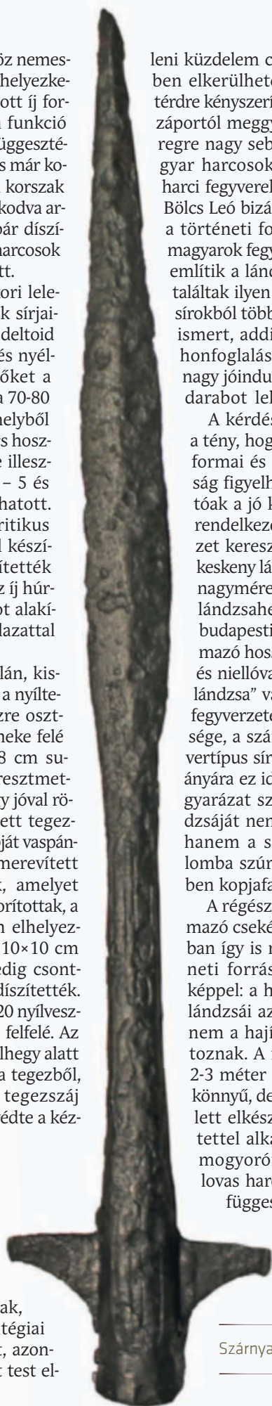
Szárnyas lándzsa Visegrádról

E probléma kapcsán a régészeti források tűnnek beszédesebbnek: a 10. századi magyar harcosok sírjaiból napjainkra már mindkét fegyvertípusból több mint száz példány látott napvilágot, ami alapján úgy tűnhet, hogy mindkettőt egyaránt használták eleink. Az aprólékos régészeti elemzés azonban ennél beszédesebb eredményt hozott: míg a szablyák végig jelen voltak a korszak magyarságának fegyverzetében, addig a kardok a 10. század második felében, utolsó harmadában kerültek be a magyar harcosok fegyvertárába egy „haderőreform” keretében.