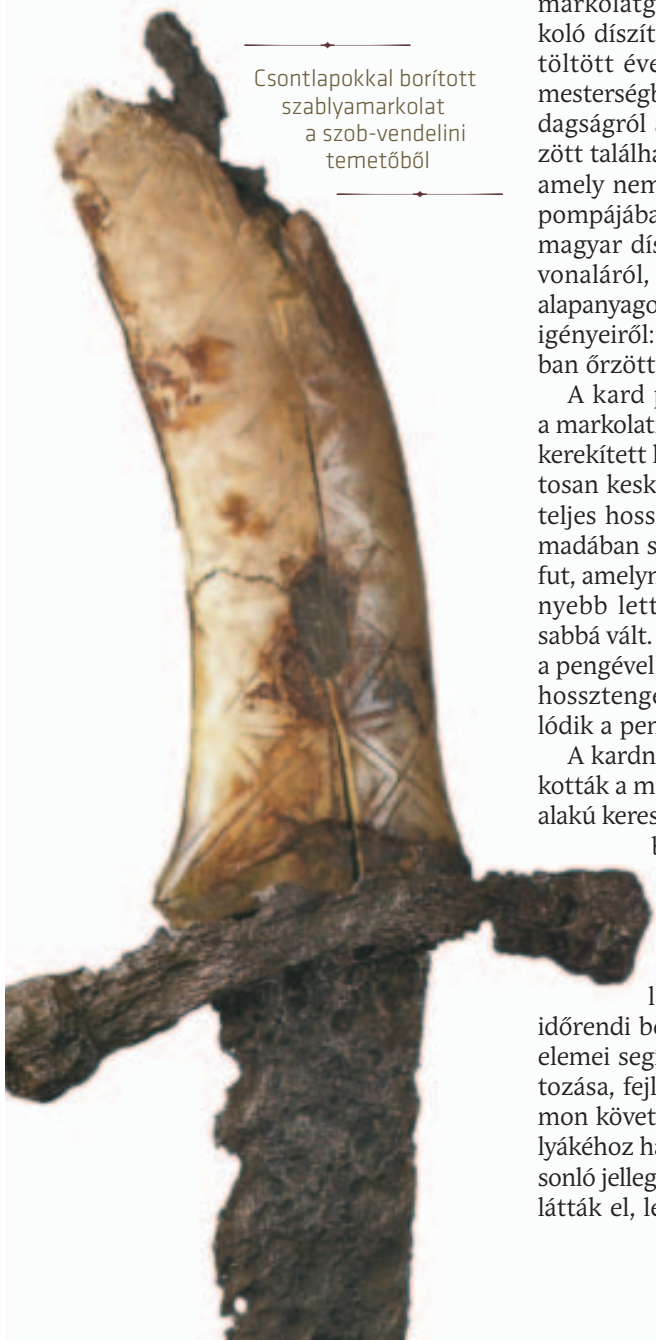
Csontlapokkal borított szablyamarkolat a szob-vendelini temetőből

leglátványosabb díszje a hüvely végén elhelyezkedő öntött koptató vagy hüvelyvég.