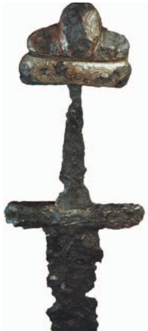
Kardmarkolat a szob-kiserdei temetőből

A kardnak szintén fontos részét alkották a markolat szerelékei: a csónak alakú keresztvas, a nagyméretű, különböző típusokba sorolható markolatgomb és a bőrrel vagy fémhuzallal körbetekert s így a markolattüskéhez szorított markolatlemezek. A kardok pontos időrendi besorolását a markolat ezen elemei segítették elő, hiszen ezek változása, fejlődése látványos és jól nyomon követhető. A kardhüvelyt a szablyakéhoz hasonlóan alakították ki hasonló jellegű és funkciójú szerelékekkel látták el, legjellegzetesebb és egyben