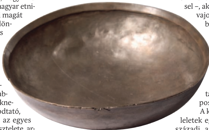
A gégyényi ezüstcsésze

mol be Anonymus is, aki szerint Kijev alatt a hét magyarhoz társult a hét „kun” vezető is, hogy azután egyenrangú honfoglalók legyenek, későbbi nemzetségek dicső ősatyjai. Bíborbanszületett Konstantin pedig a kabarok három törzsének magyarokhoz csapódásáról emlékezik meg. És mindezek csak az írott források információi, azt nem tudjuk, hogy ezeken kívül mi történhetett még. Vajon magyar – értsd: egységes eredetű – volt-e a hétmagyar?