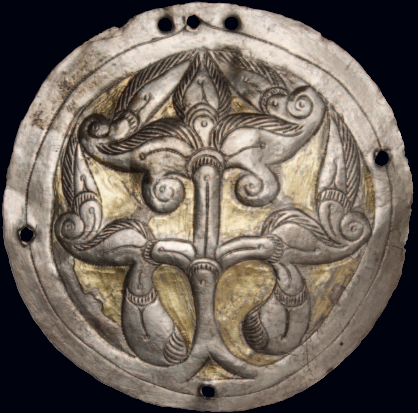
Életfaábrázolás az anarcsi hajfonatkorong