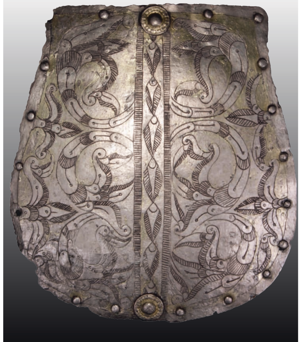
Az eperjeskei tarsolylemez

Nem könnyű a magyar őstörténet behatárolása időben visszafelé sem. A határokat itt egyfelől a kutatás lehetőségei – a rendelkezésünkre álló források – szabják meg (a kérdésre azonnal visszatérünk), másrészt kézenfekvő volna azon a ponton „kezdeni” a kutatást, amióta a magyarság mint önálló entitás létezik. Ezt a pontot azonban nem ismerjük. Egyetlen fogódzót a nyelvészet kínál: azt az időpontot,