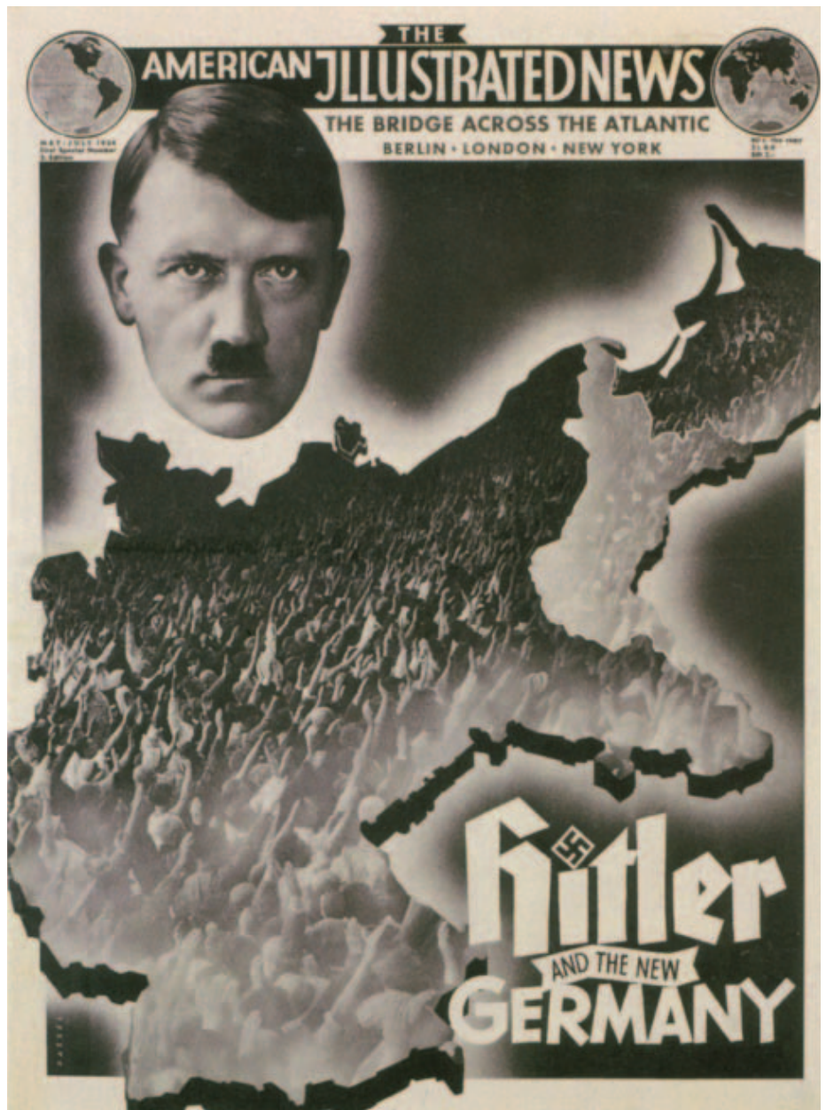
Hitlert és az új Németországot bemutató amerikai kiadvány, 1934

A rendszer békeéveiben Goebbels inkább szórakoztatási, mintsem propagandaminiszternek bizonyult. A legkisebb részletkéig beavatkozott a rádiózásba, a filmgyártásba és a művészeti