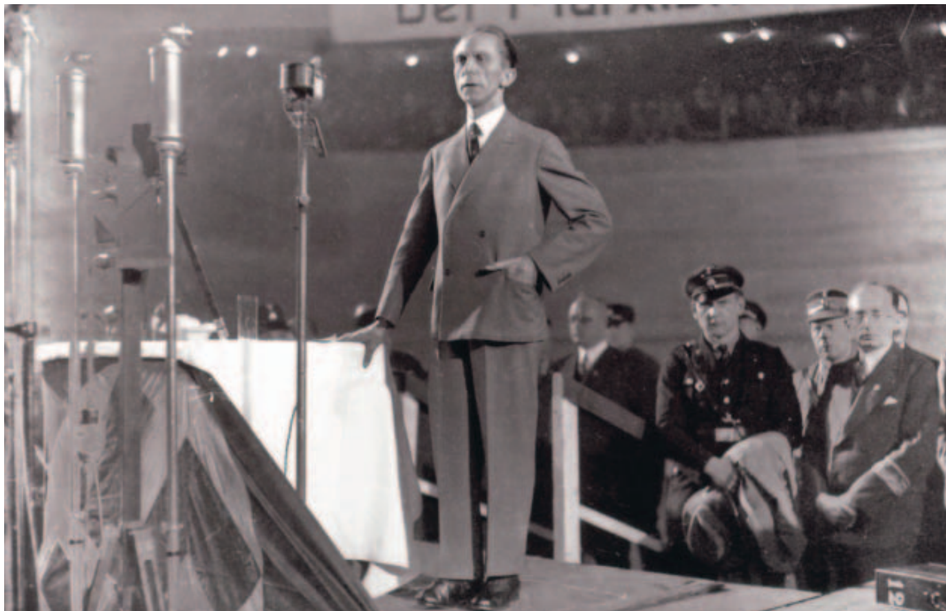
Goebbels a berlini Sportpalastban, 1933. február 10.

zösségének érzetét. A korábbi Heil! helyett bevezették a Heil Hitler! „német köszöntést”, a zárt sorokban való marsírozást és a náci párt különböző szervezeteinek felvonulását, az iskolai reggeli ünnepeket, a zászlóavatást és zászlószentelést, a fáklyás felvonulásokat, az utcai gyűjtéseket és az egytálétel-vásárnapokat. Mindezeket egyéb akciók egészítették ki: a rendszeres népszavazások, „termelési csaták”, téli segélyakciók és gyűjtések s egy-egy nap heroizálása (1933. február 27-én a Reichstag leégését az „általános kommunista felkelés kezdetének”, a március 5-i parlamenti szavazást „az ébredő nemzet napjának”, a Reichstag március 21-i megnyitását a „nemzeti felemelkedés napjának” nevezték el).