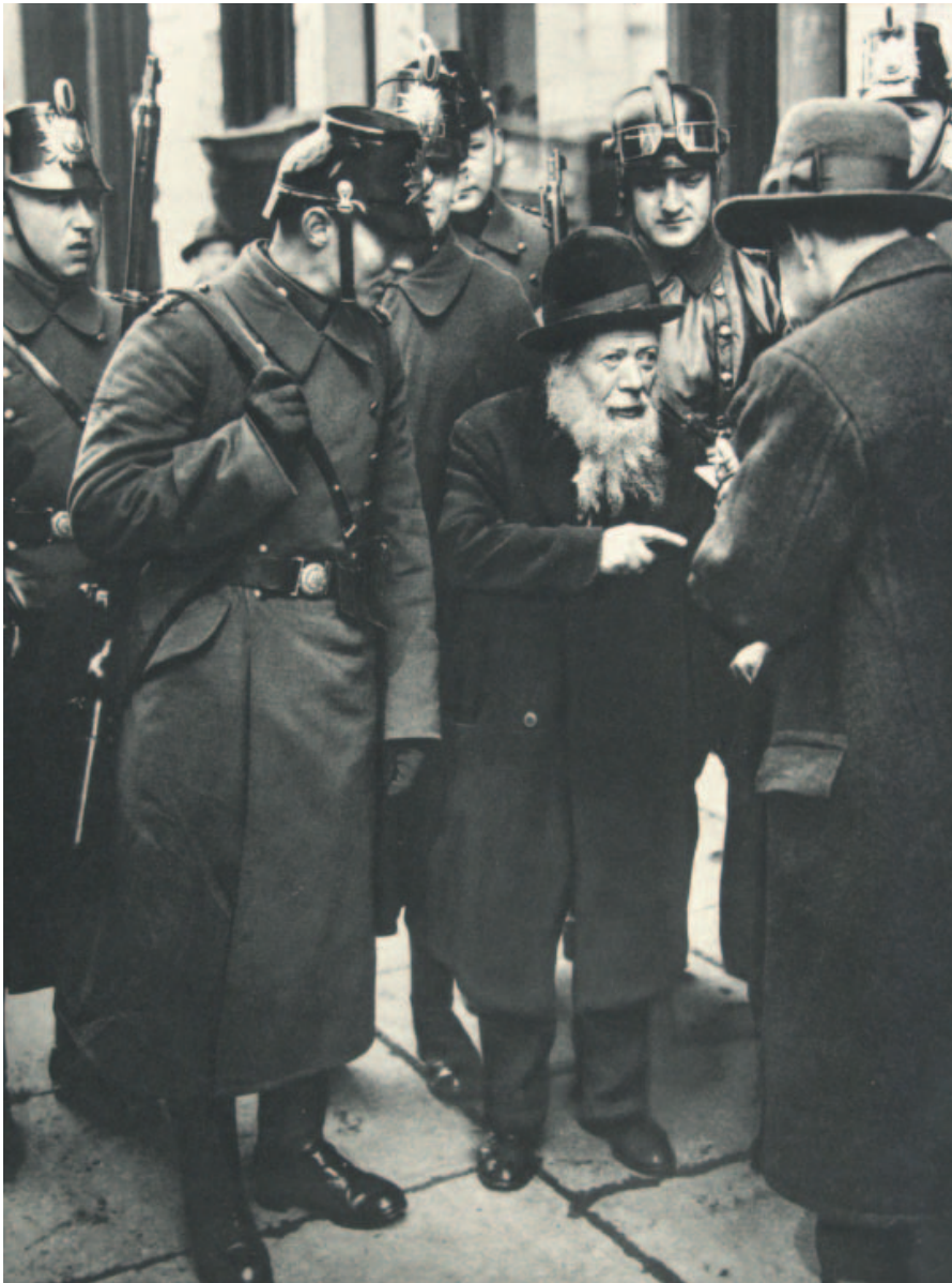
Rendőrök igazoltatnak egy öreg zsidó férfit, 1933

A nemzetiszocialista ellenségképek ebből az örökségből keletkeztek, s a zsidó-bolsevista világellenség mítoszában tetőztek, amely 1918 óta az árja