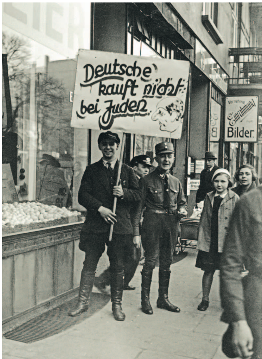
„Német nem vásárol zsidóknál” felirattal demonstráló SA-tagok, 1933. április 1.

Hitler 1912 tavaszán került Münchenbe, a minden ízében német városba. Bosszantotta a viszonyulás a marxizmushoz; 1914 nyarán, az első