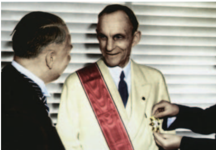
Két híres antiszemita, akik támogatták Hitlert: Henry Ford amerikai autógyáros (fent) és Houston Stewart Chamberlain (jobbra)

A zsidók – Chamberlain szerint – ázsiai népként a germánokkal együtt léptek a történelembe, s ők is óvják fajuk tisztaságát. A zsidó lélek materialista, törvénytisztelő, intoleráns és erkölcstelen. A zsidó az ördög megtestesülése, elene csak a kiválasztott nép, vagyis a germánok vehetik fel a küzdelmet. A zsidók