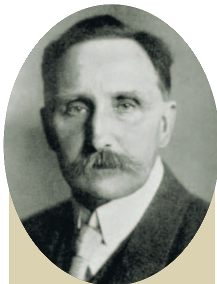
KARL HAUSHOFER 1869–1946

Az is lehetséges, hogy Hitler egyszerűen a német historiográfiában, publicisztikában és szépirodalomban a 19. század elejétől elterjedő javaslat felé fordult, mely szerint a középkorban elakadt német Drang nach Ostent kell folytatni. „Mi megállást parancsolunk