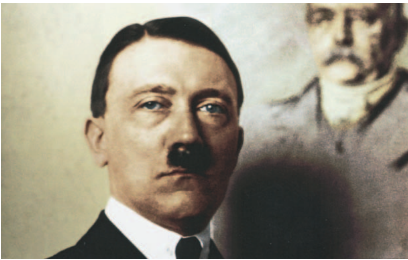
Hitler példaképei: Otto von Bismarck (fent) és Erich Ludendorff (lent)