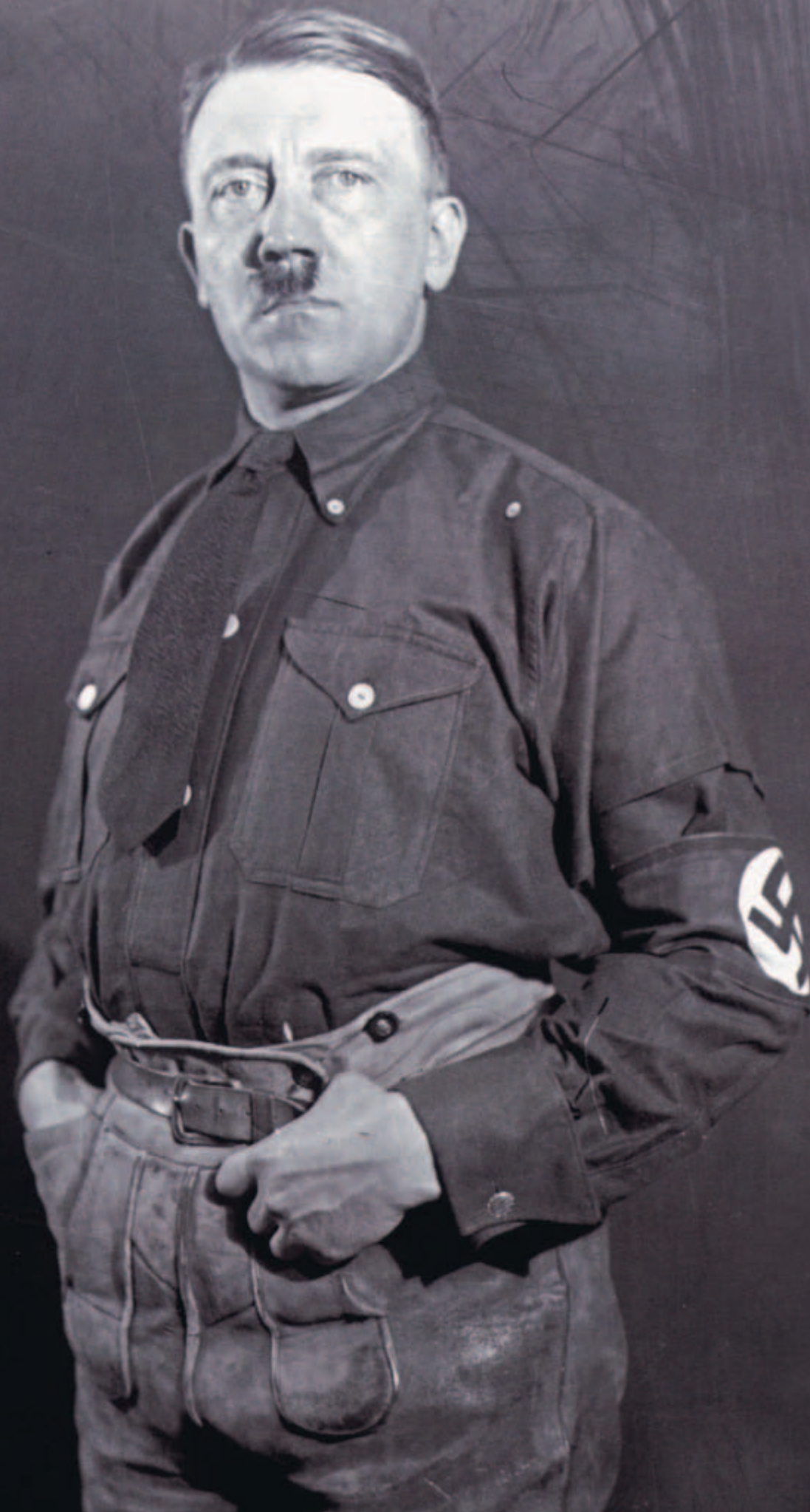
Hitler bajor népviseletben, 1929