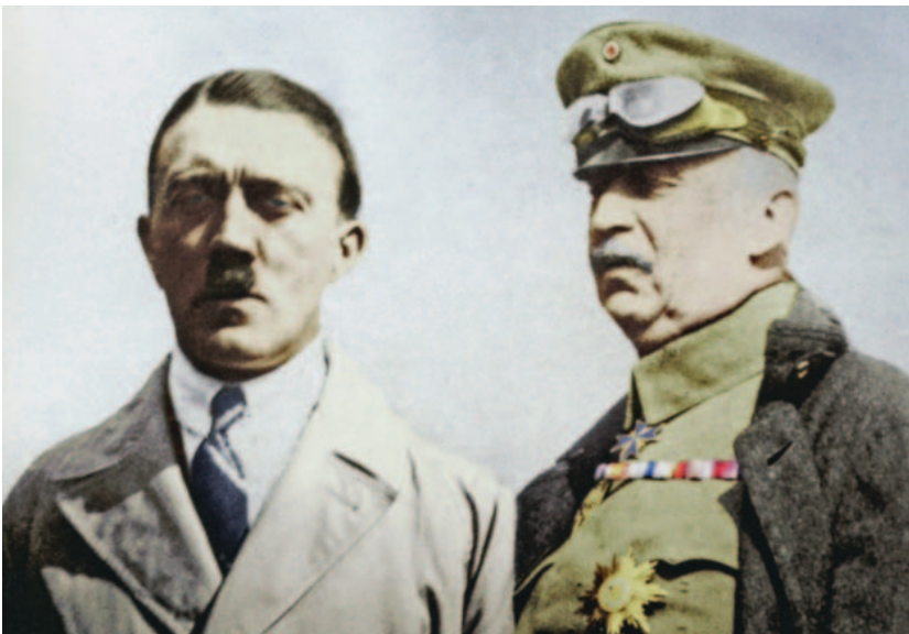
Hindenburg kancellárrá nevezi ki Hitlert, 1933. január 30.