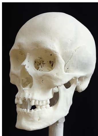
4. ábra: Rapid Prototyping (RP) eljárással előállított műanyag koponyamásolat, félprofil.

Fig. 3: The skull of a conquering man from the Tomb 6 of Tuzsér-Boszorkány-hegy, lateral view.