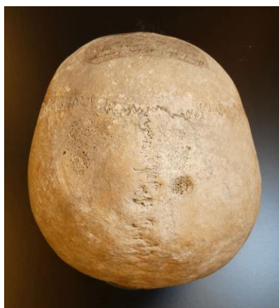
2. ábra: Jelképes trepanációk a Tuzsér-Boszorkány-hegy 6. sír koponyáján. A bal falcsonton a tabula externát és a diploét érintő mandulaalakú bemetszés; a jobb falcsonton a nyílvarrathoz közel, a koronavarrattól 32 mm-re, 15 mm átmérőjű, 4 mm mély gyógyult kerek csontseb.

Fig. 1: Skull of a Hungarian conqueror individual, frontal view (Tuzsér-Boszorkány-hegy, Tomb 6).