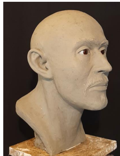
9. ábra: Arcreekonstrukció feltételezett haj és bajuszviselettel, negyed profil (Tuzsér-Boszorkány-hegy, 6. sír). Fig. 9: Facial reconstruction with presumed hair and moustache wear, quarter profile (Tuzsér-Boszorkány-hegy, Tomb 6).

A haj és arcszőrzet egyedi jellegzetességeiről szintén nem nyújt támpontot a koponya, ezért azok megjelenítésében a forrásokra hagyatkoztunk. Ismeretes, hogy a 9–10. századi nomád harcosok a fejük tetejét borotválták, míg a nyakszirt és a halánték hajtincseit egy