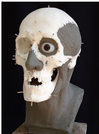
5. ábra: Készülő arcreekonstrukció a lágyszövet-vastagság mérő tövisekkel és a rágizmokkal. Már látható a külső orr alapkaraktere és a szemgolyó elhelyezkedése. Félprofil (Tuzsér-Boszorkány-hegy, 6. sír).

mesognathia figyelhető meg. A fogazat ép, a post mortalisán hiányzó frontfogakat (maxilla: j2, 4; b1, 2; mandibula j1, 3; b1–4) viaszból pótoltuk. A fogak közepes méretűek, a felső caninus-ok kissé kiállók. A fogsorív széles, parabola alakú. A rekonstruált felsőajak és az áll magas. Az ajkak közepesen teltek és mérsékeltlen előreállók. A felsőajak kissé előrébb áll az alsónál.