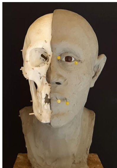
6. ábra: A félkész arcreekonstrukción a koponya egyik fele még látható. Ebben a fázisban ellenőrizzük a csont és lágyszövet formák morfológiai megfelelését. A szem-és szájszöglet helyét hosszú tűk jelölik. Előlnézet (Tuzsér-Boszorkány-hegy, 6. sír).

Fig. 5: Facial reconstruction in progress with soft tissue thickness markers and chewing muscles. The basic character of the external nose and the location of the eyeball are already visible. Half profile view (Tuzsér-Boszorkány-hegy, Tomb 6).