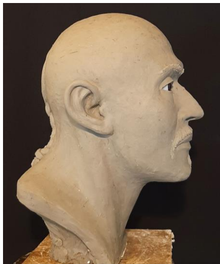
8. ábra: Arcreekonstrukció hajjal és bajusszal, oldalnézet (Tuzsér-Boszorkány-hegy, 6. sír). Fig. 8: Facial reconstruction with hair and moustache, lateral view (Tuzsér-Boszorkány-hegy, Tomb 6).