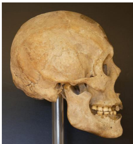
3. ábra: Honfoglaló férfi koponyája a Tuzsér-Boszorkány-hegy 6. sírból, oldalnézet.

része a munkánknak. A szobrászi formarend alkalmazása segítette az arcreszletek harmonikus illesztését és szerves egészzé formálását (6. ábra).