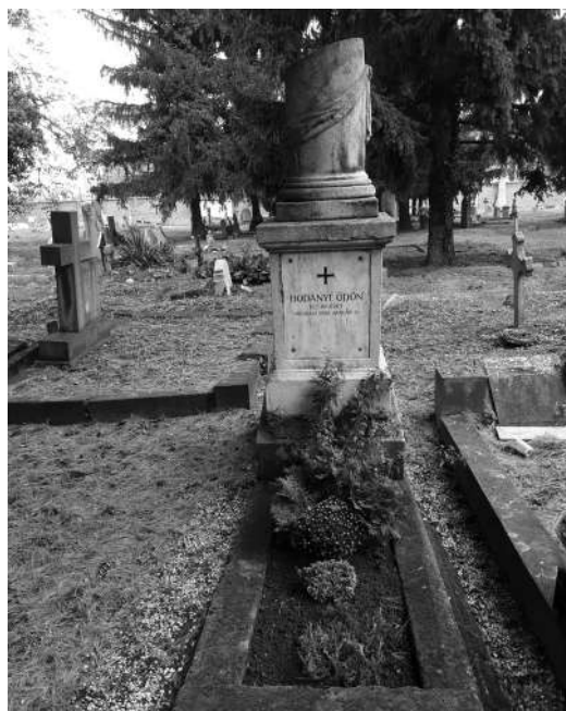
Bodányi Ödön síremléke