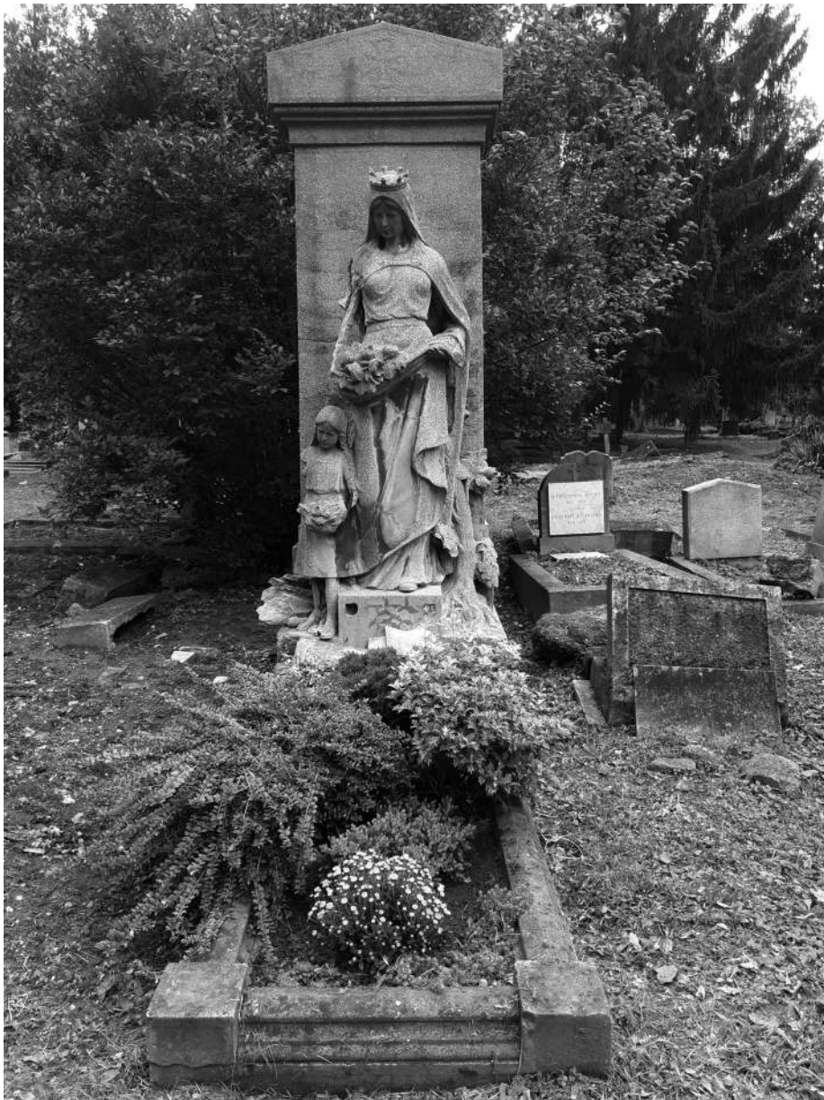
Hidassy Krisztina síremléke