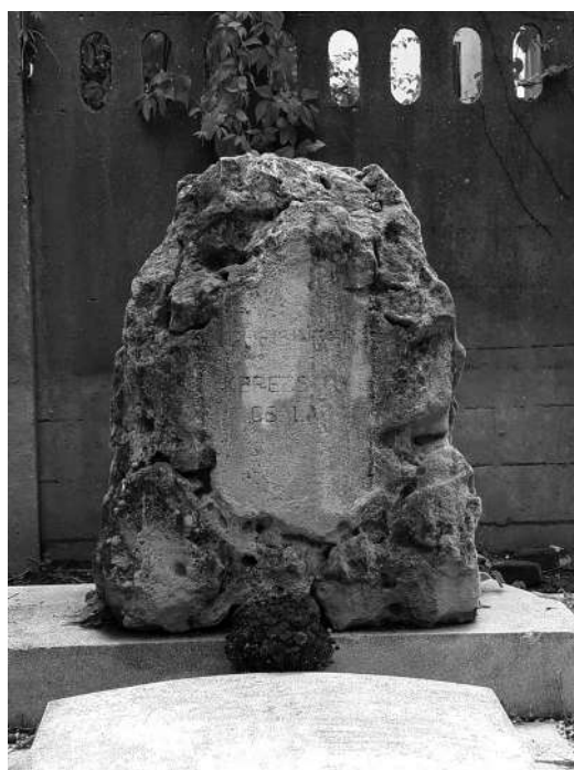
Greisinger Ottóné síremléke