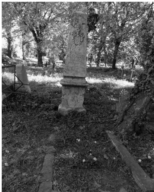
Kisfaludy József sírja felújítás előtt