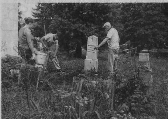
A Szombathelyi Szépfítő Egyesület tagjai munka közben