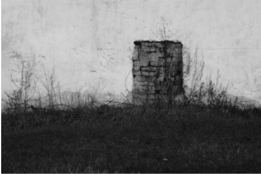
Jelenések az égi kertből