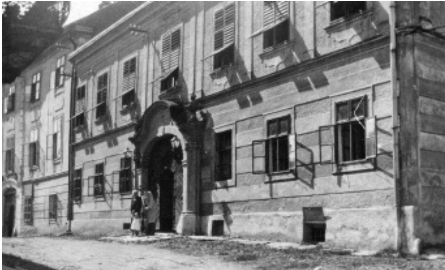
A Chernel-palota előtt