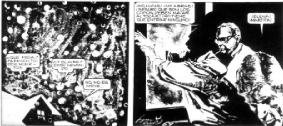
Oesterheld-Breccia: El Eternauta . Részletek a kultikus argentin apokaliptikus sci-fi 1969-es változatából