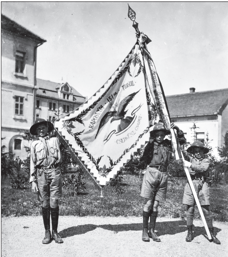
A kaposvári 151. sz. Turul Cserkészcsapat zászlótartói és zászlaja a kis vármegyeháza, azaz a levéltár épülete előtti téren 1927-ben