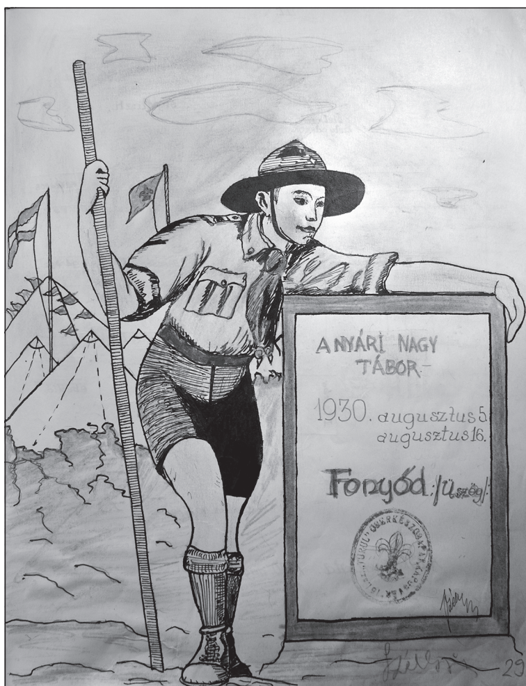
Egy oldal a kaposvári 151. sz. Turul Cserkészcsapat 1930. évi naplójából