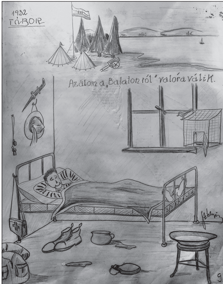
Egy oldal a kaposvári 151. sz. Turul Cserkészcsapat 1932. évi naplójából