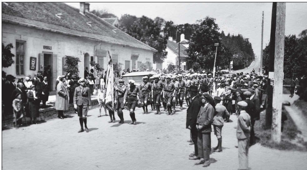
A kaposvári 151. sz. Turul Cserkészcsapat öregcserkészeinek díszmenete Lengyeltótiiban, 1933-ban

(A tanulmány rövidített változata az emlékév záróeseményén hangzott el 2018. december 3-án.)