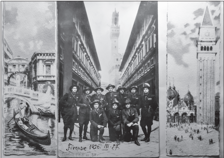
Kaposvári cserkészek kiránduláson Firenzében, 1926 márciusában