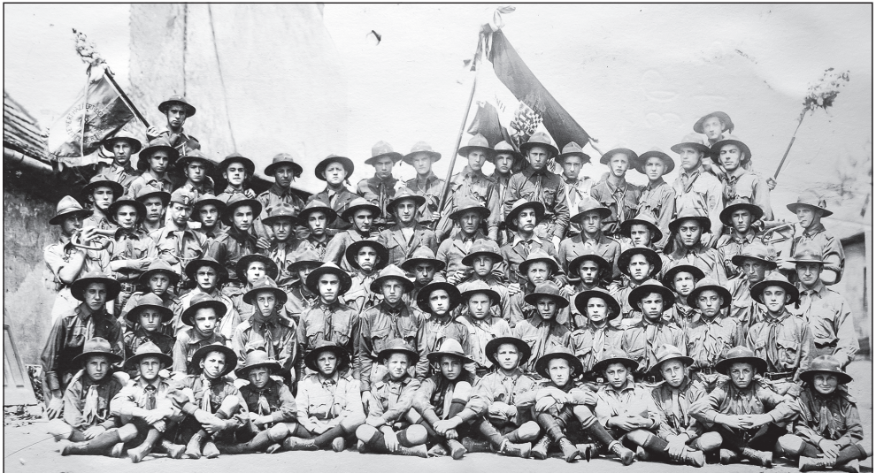
Csoportkép a kaposvári 657. sz. Gróf Tisza István Cserkészcsapat zászlószentelési ünnepélyén, 1927 májusában