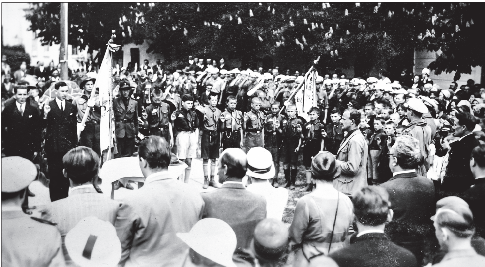
Lengyeltóti cserkészek fogadalmtétéle 1933-ban, háttérben a kaposvári 151. sz. Turul Cserkészcsapat öregcserkészei

A (B)Irodalom több olyan témát igyekszik tehát a kutatás homlokterébe állítani Gyulai személye és munkássága kapcsán, amellyel az irodalomtörténet már régóta adós.