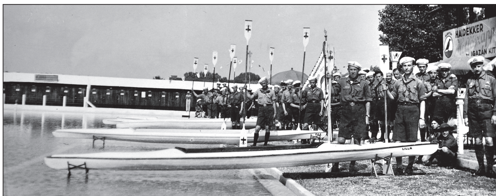
A kaposvári 151. sz. Turul Cserkészcsapat öregcserkészzeinek vízi raja bemutató előtt, Kaposvárrott, a Tüskevári Strand medencéjénél 1934-ben