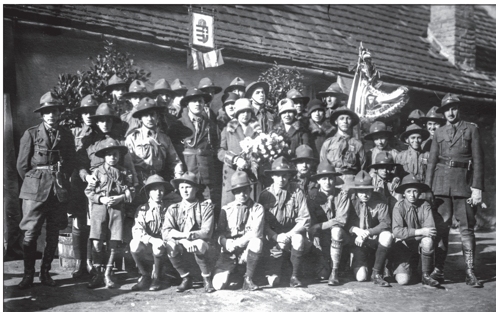
Csoportkép a kaposvári 151. sz. Turul Cserkészcsapat Kuruc rajának zászlószentelésekor, 1927 novemberében

A BERZSENYI DÁNIEL IRODALMI ÉS MŰVÉSZETI TÁRSASÁG ELNÖKE