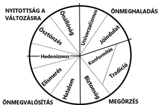
1. ábra. Schwartz értékmodellje