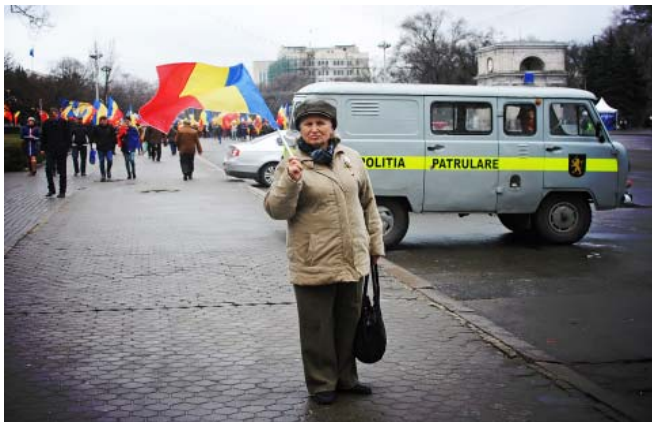
Forrás: Giuliana Califano fényképfelvétele, 2015.

Bár a romániai és a moldovai emlékezetpolitika között is jócskán vannak a magyar–román viszonylatban megfigyeltekre hasonlító feszültségek, a nemzeti ünnepek nemcsak a súrlódások, hanem a közeledések lehetőségét is tartogatják. 2011 végén került a bukaresti törvényhozás elé az a javaslat, amely azt indítványozta, hogy augusztus 31-ét – ami Moldovában nemzeti ünnep – nyilvánítsák a román nyelv napjává. 25 A javaslatot Traian Băsescu elnök is támogatta, 2013-ban pedig elfogadta a román parlament, így azóta „közös” a két ország ünnepnapja (Iosip 2017). Erre hasonlít egy másik, folyamatban lévő emlékezetpolitikai kezdeményezés is: 2017 tavaszán Romániában nemzeti ünnep lett március 27-e, Besszarábia és Románia egyesülésének évfordulója (Mediafax.ro 2017). 26 Ugyanekkor a moldovai Liberális Párt is benyújtott egy törvényjavaslatot, amely szintén nemzeti ünnepé tenné az évfordulót – mintegy „hivatalosítva” az unionista és romániai szervezetek által amúgy is rendszeresen megtartott megemlékezéseket. 27