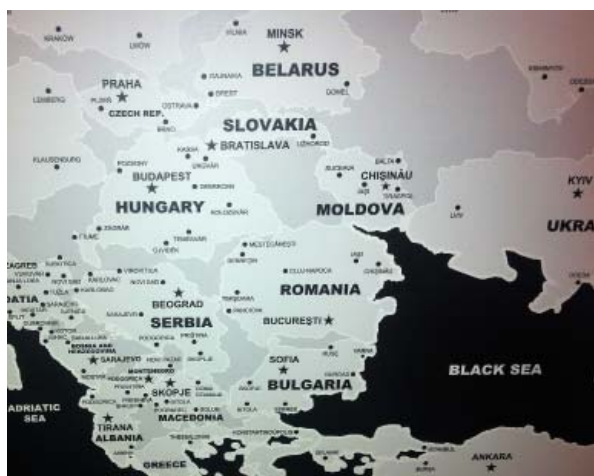
1.  bra. A Soci t  R aliste t rk pe

Forr s: Patakfalvi-Czirj k  gnes  s Zahor n Csaba f nyk pfelv tele a Priv t Nacionalizmus Projekt budapesti ki llit s r l, 2015.