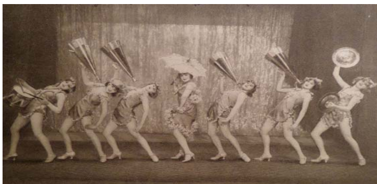
1–2. ábra. Miss Arizona Miniatur Revue – My Baby