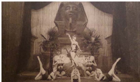
3. ábra. Miss Arizona Miniatur Revue – Reine de Saba