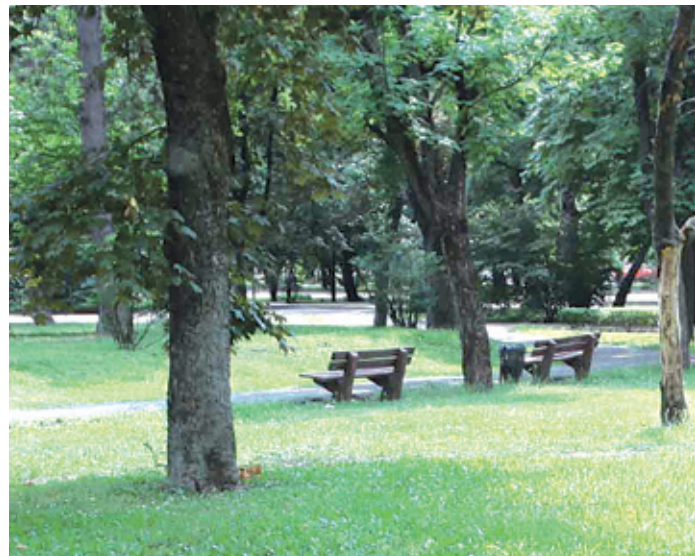
Többfunkciós parkokra van szükség a városokban

A Hollandiából 2003-ban induló Green City mozgalom hozzánk is elért: az a város csatlakozhat hozzá, amelyik kellő zöldfelülettel rendelkezik. A programmal elsősorban a városiak nyernek.