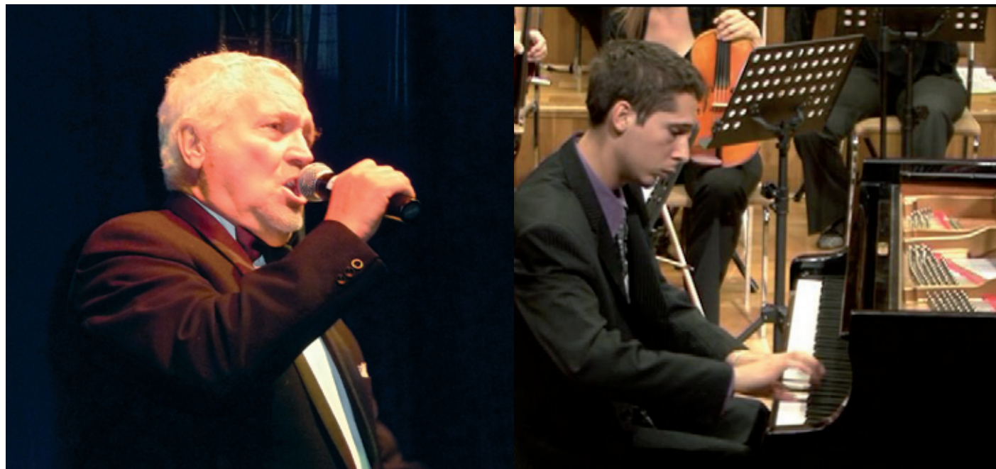
Nógrádi Tóthék életét meghatározza a magyar nóta, amelynek szeretete apáról fiúra szállt

Az apa énekel, a fia zongorázik és táncol