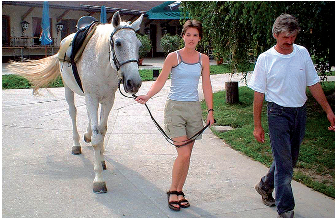
A hallássérültek tökéletes összhangot alakítanak ki kedvenc állataikkal

„Ma már lehetőség nyílik a súlyosan hallássérült hallgatók felmentésére a nyelvvizsga alól, valamint a fogyatékoságukra tekintettel bizonyos tantárgyak kiváltására is.”