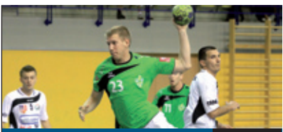
LŐRINCI FRADI 15. oldal

A kerületet választották állampolgársági fogadalmuk helyszínéül a testvérváros Tusnádfürdő, valamint a Pestszentlőrinc-Pestszentimrével régóta jó kapcsolatot ápoló Körösfő lakosai. Az ünnepséget a Rózsa Művelődési Házban tartották, ahol Németh Zsolt, a Külügyminisztérium államtitkára és Ughy Attila polgármester 64 új magyar állampolgárnak gratulált.