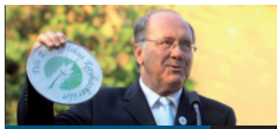
SULINYITÁNY 3. oldal

Az új kerületi sportkoncepció ugyan csak december végére lesz teljes, de szeptember 24-én izéltőt kaphatunk a tervekben, amikor a Bókay Kertben a kerület sportegyesületei bemutatókat tartanak, tanácsadással segítik a sportágválasztást, amelyet az is előmozdíthat, hogy több mint tucatnyi sportágot lehet ezen a napon kipróbálni a parkban.