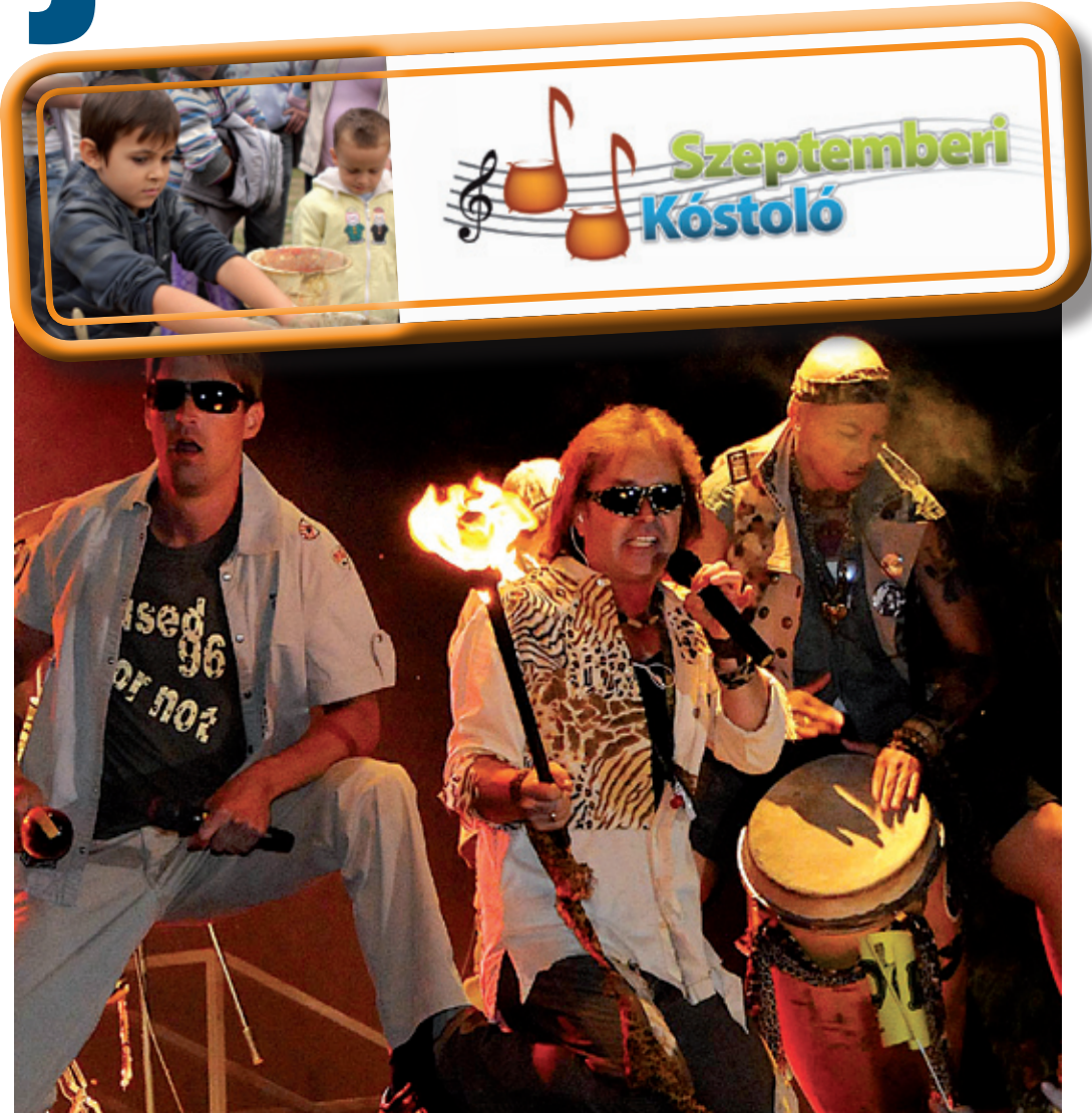
Az egésznapos dínom-dánom után az R-GO slágerei mozgatják meg a közönséget

A fergeteges hangulatról olyan ismert és kedvelt előadók gondoskodnak, mint Charlie és Deák Bill Gyula, hogy aztán a szombat esti szuperprodukció díszletei között már az R-GO slágereire mozogjon a kéz és a láb. Mielőtt azonban rockzenére vagy éppen a „csikidam” taktusaira tombolna a közönség, a vendégek sokszínű repertoárból csemegézhetnek. Az Operettszínház művészei,