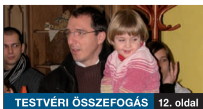
TESTVÉRI ÖSSZEFOGÁS 12. oldal