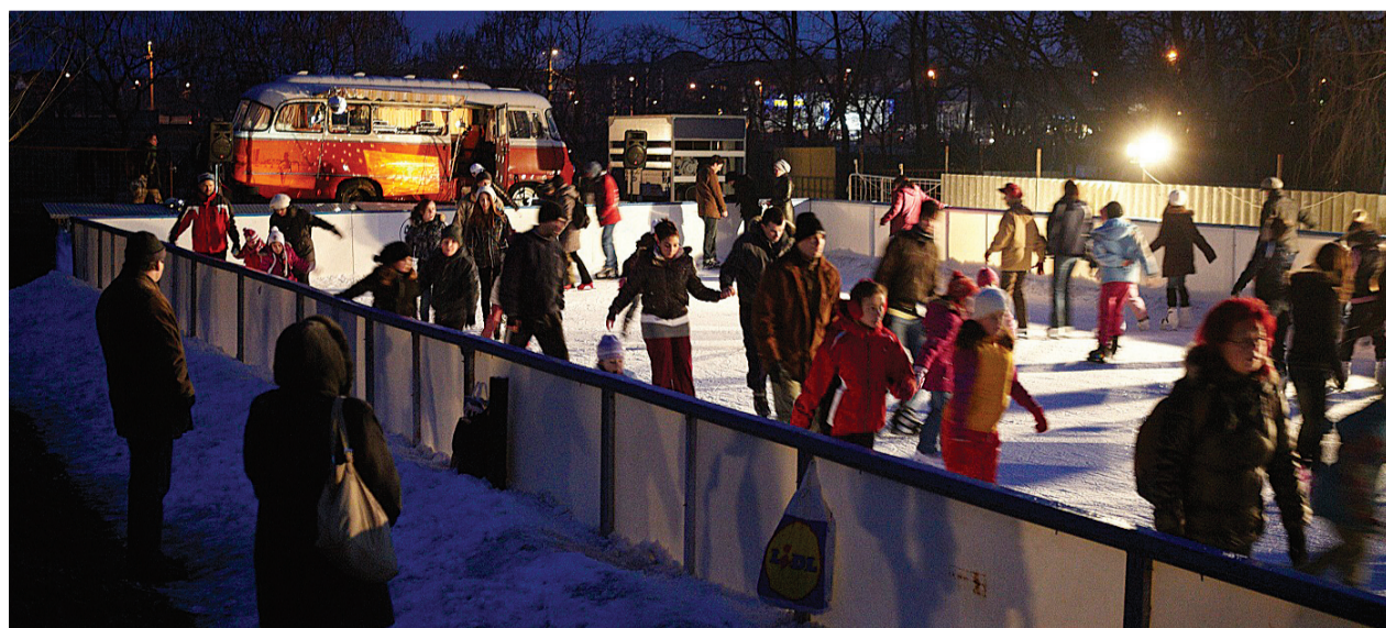
A jégpálya február végén bezárt, de a tervek szerint a következő szezonban is kinyit

Az ötlettől nagyon gyorsan sikerült eljutni a megvalósításig. A felvetés először az Oktatási, Közművelődési, Sport- és Ifjúsági Bizottság (OKSIB) ülésén került elő, ahol a tagok teljes egyetértéssel fogadták. November közepén a lehetséges kivitelező terepbejárást tartott a Bókay Kertben, több lehetséges helyszín közül kiválasztotta a régi teniszpályát, amely védett és jól ellátható területen fekszik, december 9-én pedig az OKSIB egy újabb ülésén döntött a pálya meg-