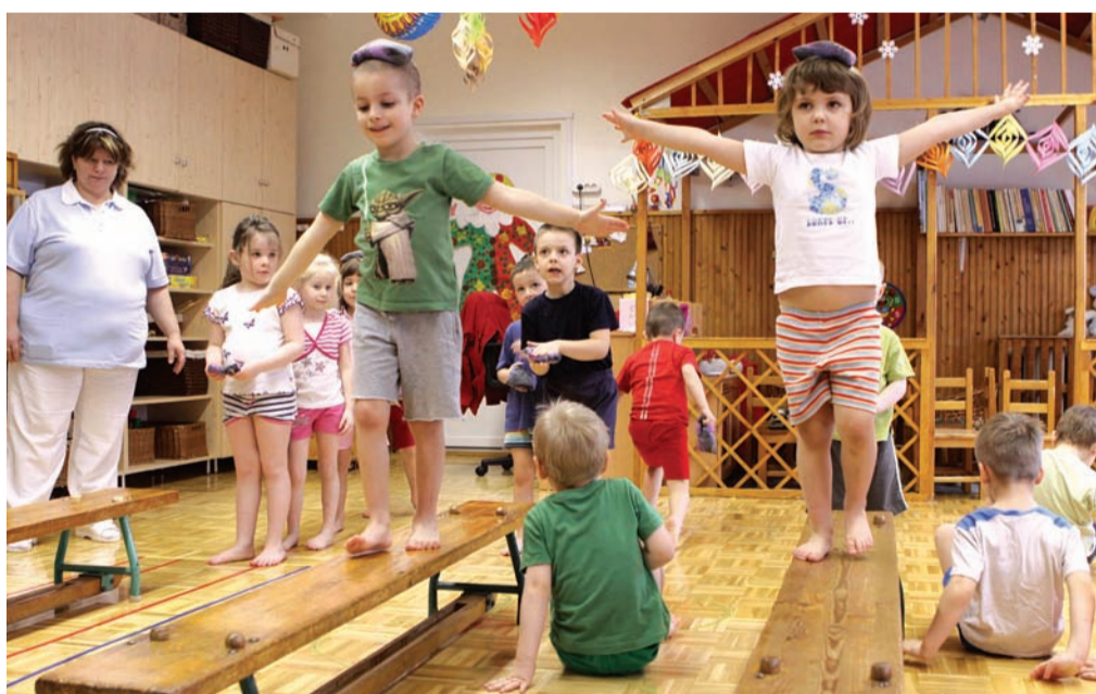
Az óvodák praktikus ötletekkel oldják meg a tornaszoba hiányát

A Zöld Liget Óvoda több mint 60 évvel ezelőtt, 1950-ben épült, ekkor még nem volt kötelező tornaterem építése az óvodákba. A probléma az, hogy ez azóta sem történt meg – hiányoznak a tornatermek.