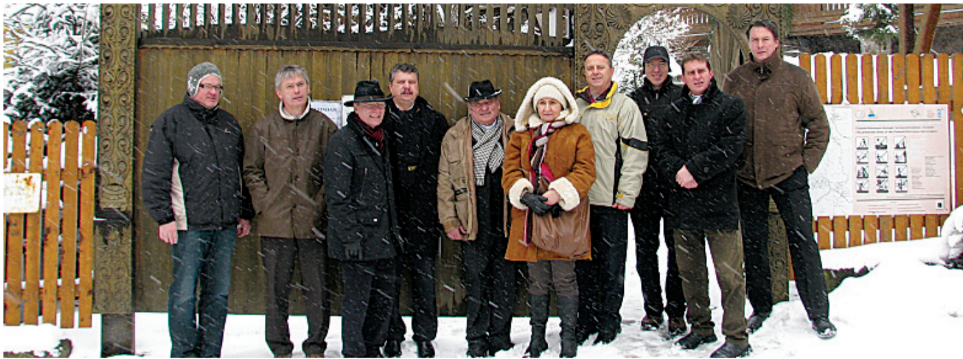
A székelykapu előtt összegyűlt a kerületi és a bajor küldöttség a vendéglátókkal

Szegény sorból érkeztek, de most kényelmesen, szép körülmények között élnek a tusnádfürdői gyermekotthon lakói. Egyetlen dolog hiányzik még: egy közösségi épület, ahol mind a 96-an összeülhetnek. A XVIII. kerület, mint testvérváros, eldöntötte, hogy segít a szükséges 12-14 millió forint előteremtésében.