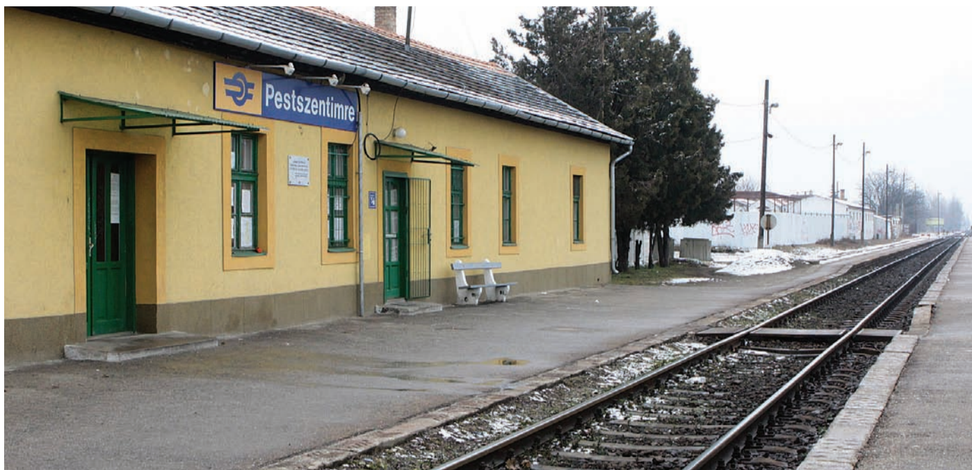
A vasútnak köszönhető Pestszentimre fellendülése, egy kis fejlesztéssel ismét népszerű lehet