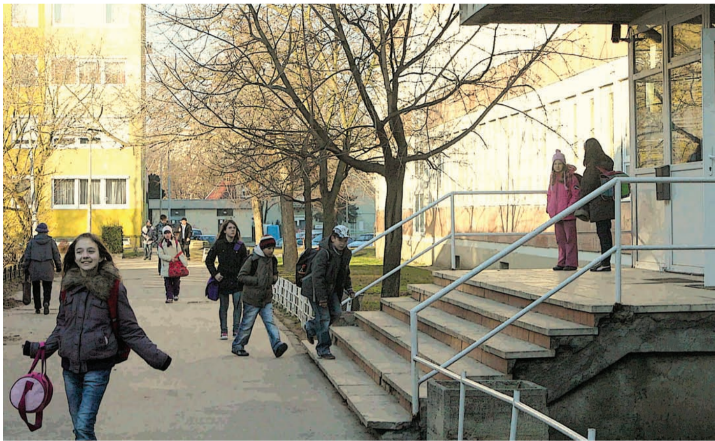
A költségvetés elfogadása után a Darus iskola bizakodhat, a tervek szerint kívül-belül megszépül az intézmény

A városvezetés arra kérte a képviselőket: javaslataikban a feladatok mellett jelöljék meg azt is, szerintük milyen belső forrásból nyerhető pénz annak elvégzésére. A kérés mindenki komolyan vette, ennek köszönhető, hogy – amint arról Hunyadi István városigazgató tájékoztatót – a javaslatok jó része végül beépült a polgármester által előterjesztett módosított szövegbe, és csak néhány egyéb