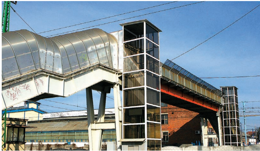
A hibás tervezés miatt a lift nem használható a bevásárlóközpontnál

Többszöri helyszíni egyeztetés történt. Készült egy terv a térszíni vizek megfogására, összegyűjtésére és szivattyúk telepítésével a vasút alatti átvezetésére a jobb oldalon lévő patakmederbe. Jelenleg a terv beárazása zajlik. Az éves felülvizsgálat keretében a lifteket – az említett probléma miatt – decemberben le kellett zárni. Mivel uniós forrásból épült a felüljáró, így az utólagos átépítés finanszírozását kell kidolgozni.” → S. N, Zs.