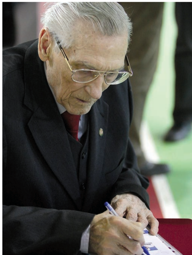
Az aranycsapat kapusa írta alá az okleveleket

Miről ismerszik meg egy focitorna, ha egyházi szervezésű? Egyebek mellett arról, hogy apácák, papok és lelkészek is jelen vannak a nézőtérben, miközben a pályán még kihagyott helyzet vagy szabálytalanság esetén sem hallatszik szitkozódás, csúnya beszéd.