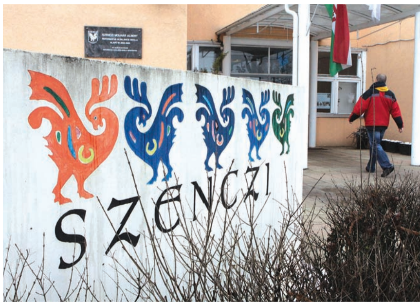
A jellegzetes motívumok az iskola szimbólumai lettek