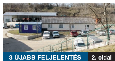
3 ÚJABB FELJELENTÉS 2. oldal