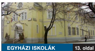
EGYHÁZI ISKOLÁK 13. oldal

A kerületi önkormányzat kezdeményezésére testvérvárosainkkal összefogva épülhet meg Tusnádfürdőn a Dévai Szent Ferenc Alapítvány gyermekotthonának a közösségi háza. A megvalósítás érdekében az önkormányzat május 21-én nagyszabású, exkluzív bált rendez a Pestszentimrei Sportkastélyban.