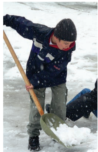
Maugli a hóban