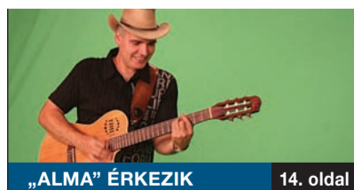
„ALMA” ÉRKEZIK 14. oldal

A Szent Lőrinc Katolikus Általános Iskola oltalmazó falairól az egyik diák szülője fogalmazott a legutóbbi alkalomban. „Olyan ez az iskola a mai világban, mint egy oázis”. Az oktatási intézményben a gyermekek – testi, szellemi és lelki – teljes körű nevelésére törekednek, különös tekintettel a hagyományos értékekre.