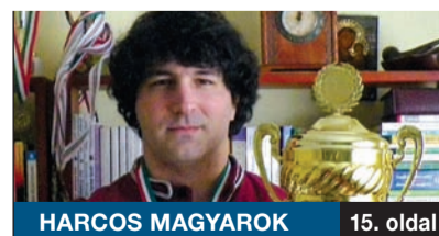
HARCOS MAGYAROK 15. oldal

Az országszerte méltán népszerű Alma Együttes lép fel március 13-án a Rózsa Művelődési Házban. Az együttes zenéje kicsiknek és nagyoknak is egyaránt szól, hiszen a gyönyörű megzenésített verseket, a jópofa dalszövegeket gyerekek és gyereklelkű felnőttek éppúgy szerethetik, dúdolgathatják.