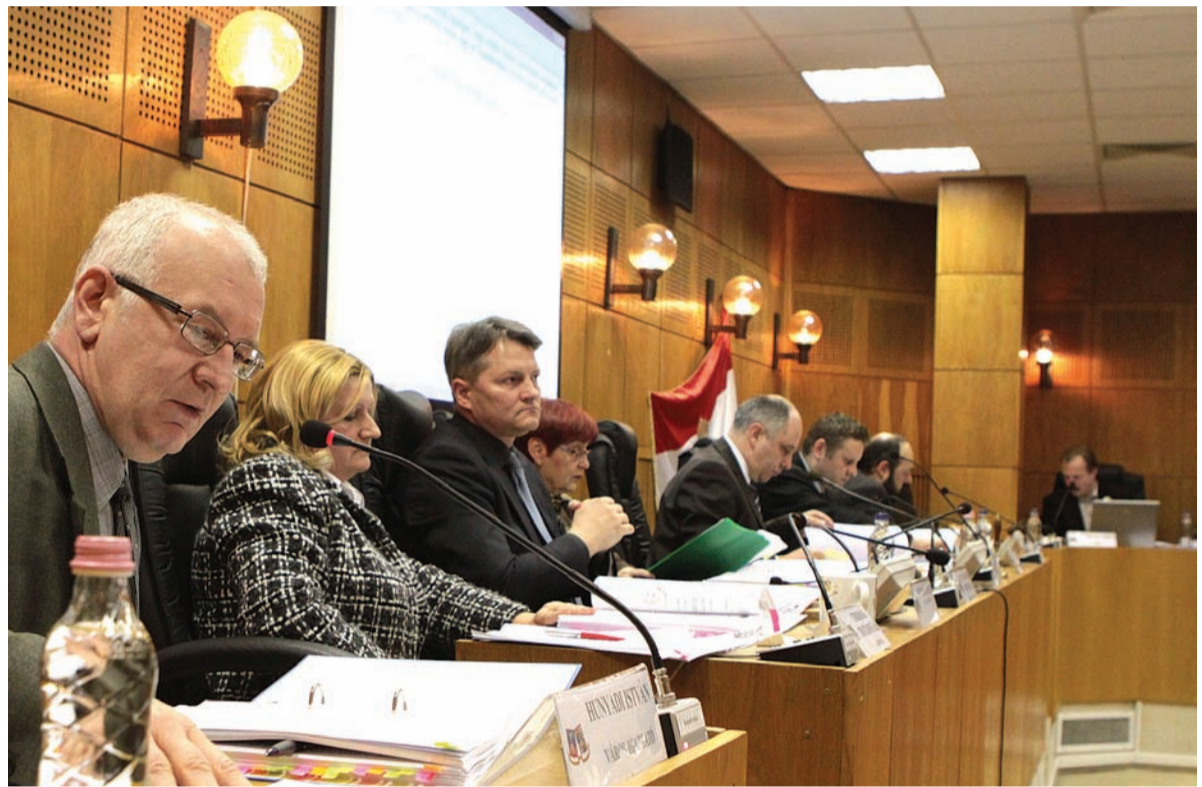
Az épített környezet helyi védelméről egyhangúlag döntött a testület

megfelelő telekméreteket megtartandók, további telekosztás nem engedélyezhető ugyanakkor a korábban kettéosztott telkek összevonása engedélyezhető, a telekhatár-rendelet nincs korlátozva. 7. Környezettel idegen formai, szerkezeti, anyaghasználati megoldások nem alkalmazhatók. Törekedni kell az eredeti szerkezetek és anyagok újraterjesztésére, 8. Az értékes, karakteres épületek homlokzatainak csak a teljes homlokzatra kiterjedő fel-