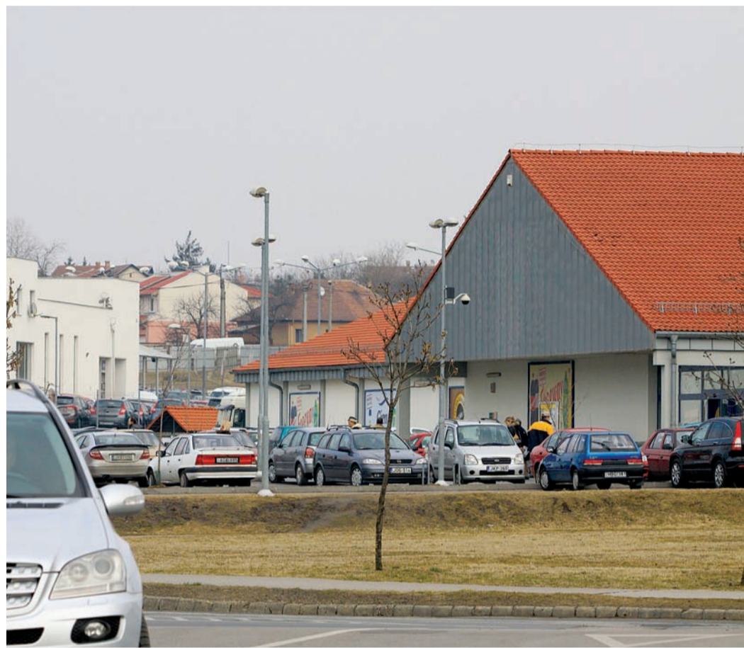
Gloriett lakótelepen élők többsége már sokallja a bevásárlóközpontok számát

A túlzottan szaporodó bevásárlóközpontokról vitakoztak a képviselők